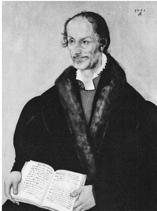
Philipp Melanchthon (Lucas Cranach munkája)

A fél világgal levelezett. Címzettei közé tartozott két király és a velencei dózse is. VIII. Henrik angol uralkodó többször tett kísérletet, hogy ezt a világhírű tudóst országába csalja. 1535-ben ugyanezt I. Ferenc francia király is megpróbálta. Fejedelmekkel, főurakkal, nemesi családokkal, városi tanácsosokkal, egyetemekkel állt levelezésben. Témái szinte áttekinthetetlenek: iskolaalapításhoz adott tanácsot vagy készített terveket. Megkeresték őt nehéz kérdésekkel, mint ahogy a kiélesedő politikai helyzetben is sokszor kértek tőle útmutatást. Mert Melanchton nemcsak az