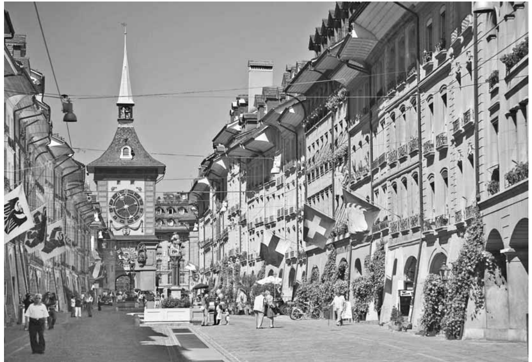
Bernben, Svájc fővárosában az erdélyi túrázók a magyar református testvérek vendégszeretétét élvezték

Másnap Thunig gurultunk a biciklivel, ahol járművet váltva Svájc leghosszabb folyóján, az