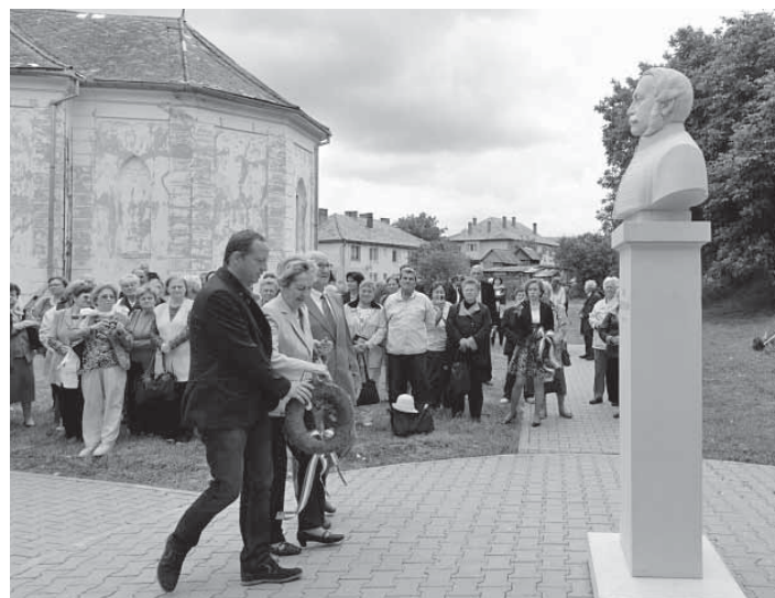
Koszorúzás a Kemény-szobor előtt

Az egyházmegyei imanapokat márciusban indították el a Kolozsvári Ref. Egyházmegyében. A Presbiteri Szövetség szervezésében öt templomban imádkoznak egyházunkért, családjainkért, gyermekeinkért és fiataljainkért, népünk megmaradásáért, valamint a szórványban élőkért. A kolozsvári Kakasos-templom, a magyarfenesi és pusztakamarási gyülekezet után a nyár folyamán a hidelvi és a törökvágási egyházközségek is bekapcsolódnak az imaláncba.