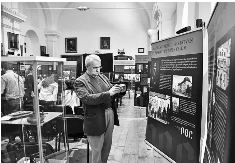
A kiállítás protestáns iskolák, tanítók és diákok élettörténetét eleveníti meg

gyülekezeti lelkipásztorok, mások tanárok, tanítók lettek. Buzogány Dezső szerint Erdély-