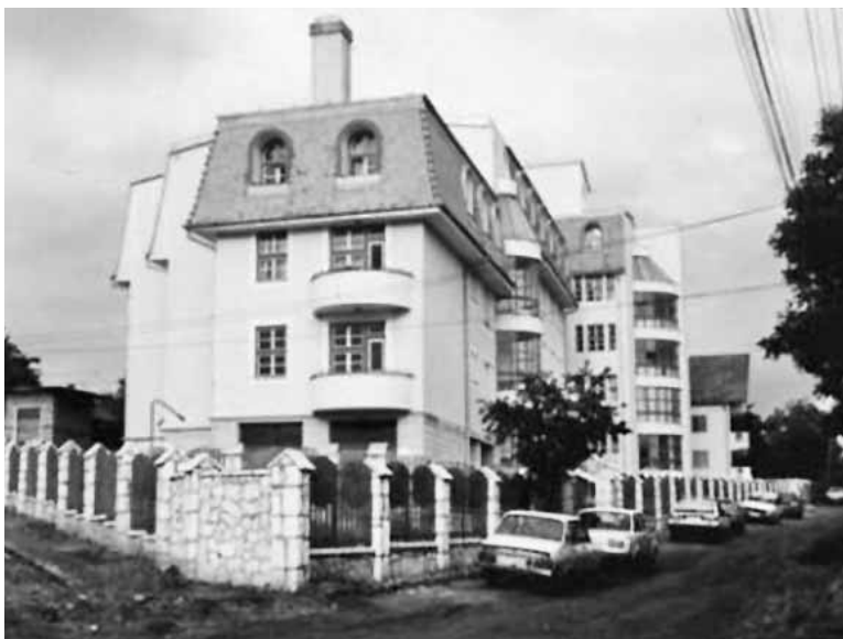
A kolozsvári Bethlen Kata Diakóniai Központot 1996-ban avatták fel