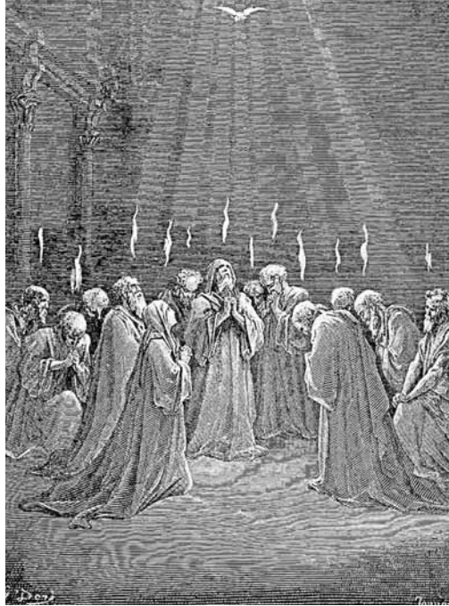
A Szentlélek kitöltetése

A pünkösöd hasonlít a húsvéhoz abban, hogy ünnepkör, és nem csupán egynapos ünnep, ami áldozócsütörtöktől Szentháromság vasárnapjáig (pünkösöd utáni első vasárnapig) tart. A magyar nép az elmúlt évtizedekben mintha elfelejtette volna a pünkösödöt. Ez nem csupán azt jelenti, hogy a pünkösdi üdvözetek küldése és a népszokások kimentek „dívatból”, hanem sajnálatosan azt is, hogy még a templomba legalább nagy ünnepeken eljáró reformátusok egy része is más programot szervez arra az időre.