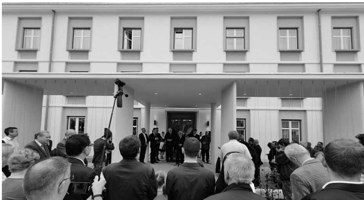
Sepsiszentgyörgy újabb, nemzetpolitikai szempontból is fontos intézménnyel gyarapodott