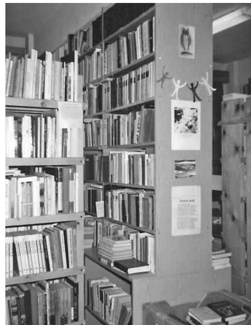
A könyvtár mindenki számára elérhető

– A HEKS öt évig támogatott minket. Később a Határon Túli Magyarok Hivatala, a Sárospataki Nagykönyvtár, a Magyarországi Református Egyház Külmisziói Intézete, a katolikus