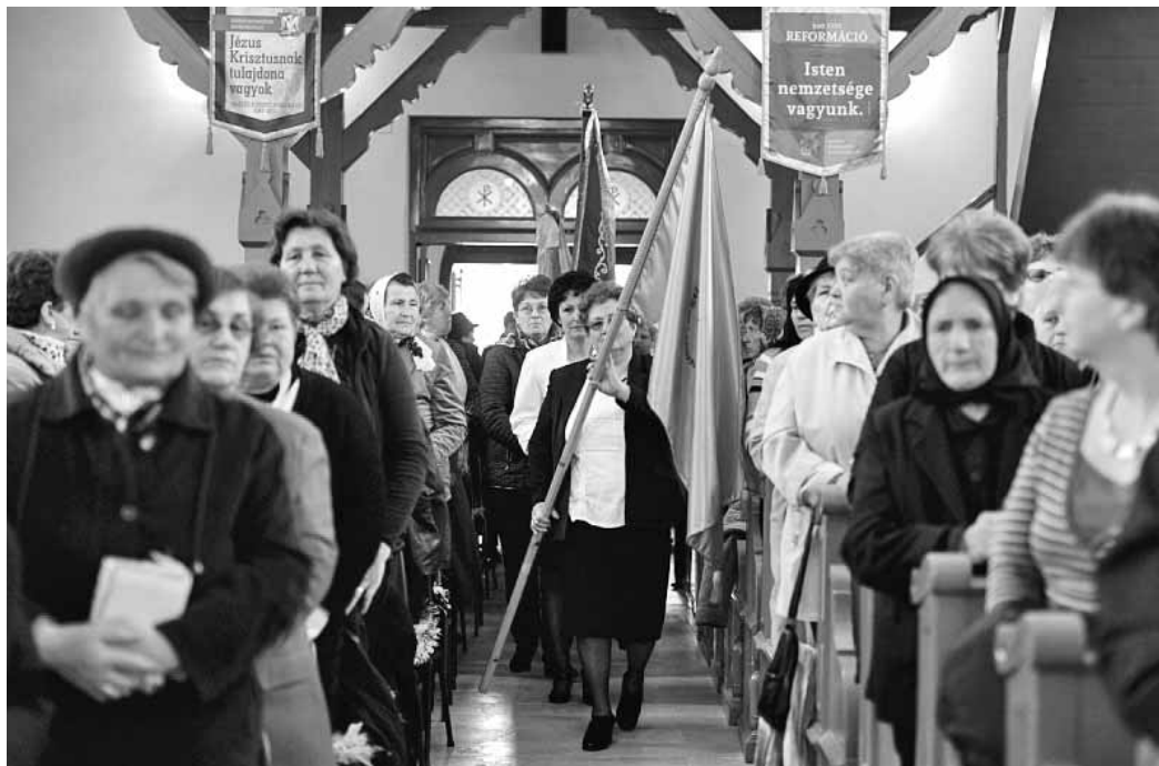
Bevonulás a templomba. Érkeznek a nőszövetségi zászlók

Ósz Előd előadásában kitért a reformáció meghatározására, kijelentette, hogy az nem innovációt jelent, mert hitet csak kapni lehet, megújítani azonban nem. A reformátorok nem újat akartak hozni, a reformáció ugyanis inkább visszaalakítást jelent. Az előadó Luther életéről mesélt, elmondta: 1525-ben Luther feleségül vette Katharina von Borát, aki a háztartást vezette, sörfőzdét is működtetett. Luther ekkor már több betegséggel is küzdött, felesége szigorúsága még 21 évig életben tartotta. Családi életük sem volt a legmeghittebb, diákok laktak náluk, akikre szintén főzni kellett, állandó közősség volt náluk. Hat gyermekük született, ezek után Luther teológiája is sokkal emberközelibb