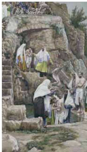
A tanítványok keresztelnek. James Tissot festménye

mak, amikor különösképpen keresünk valamit – jó esetben valakit. Amikor csak valamit keresünk, baj van. A legnagyobb baj pedig az, ha már semmit sem keresünk. Egyházi berkekben azért szoktunk keresni, mert a napkeleti böl-