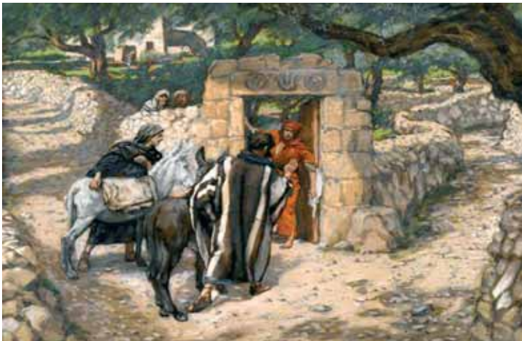
A bethfagéi csikó. James Tissot francia művész festménye

„Eszetekbe juttatom, testvéreim, az evangéliumot, amelyet hirdetem nektek, amelyet be is fogadtatok.” Az evangélium sarkalatos tanítása az, hogy Jézus feltámadt. Ha nem támadt fel, akkor vége az egésznek. Olyan ez, mint amikor egy szegre felakasztjuk a kabátot, és ha a szeg kilazul, minden a földre esik. Pál apostol szerint az alapvető bizonyágtétel hitünkről az, amikor kijelentjük: Krisztus feltámadt. A korinthusiak keresztyénnek vallották magukat, de inkább a lélek halhatatlanságában hittek, és így érveltek: mi meghalunk, a test elrohad, a halhatatlan lélek azonban kiszabadul a testből,