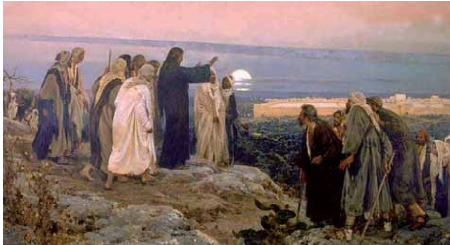
Jézus az Olajfák hegyén. James Tissot festménye

tése keveredett a csödület hangulatában. Ezért voltak, akik felsőruhájukat terítették az útra, a tanítványok között is akadt, aki felsőruháját terítette a csikóra, s Jézus erre ült. Mindegyik bevonulástörténetben a tömeg ujjongó köszöntése ugyanúgy kezdődik: Hozsánna a Dávid Fiának! A tömeg tudva, vagy sem, a Szabadító Jézust üdvözölte, bár akkor ezt még nem látta, nem értette.