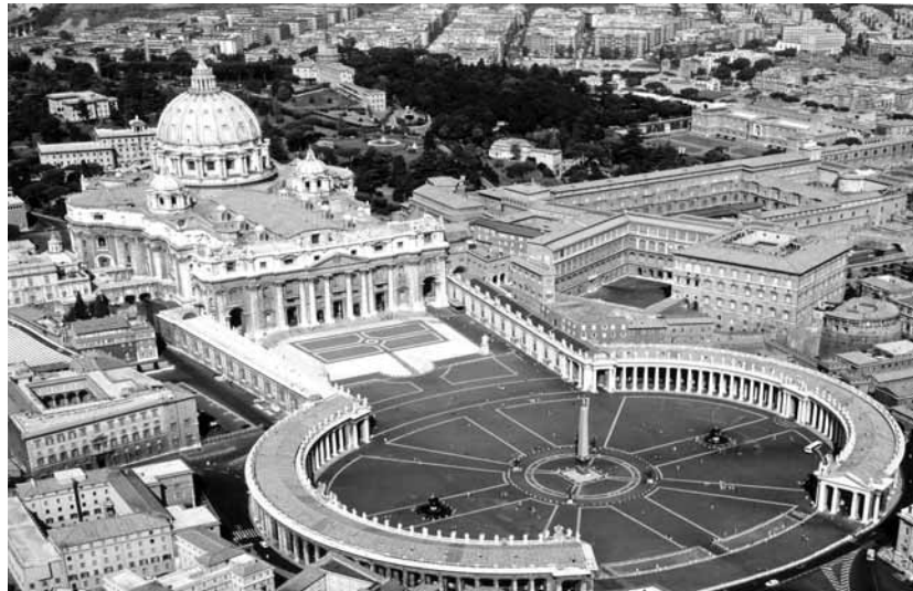
A római Szent Péter tér Bernini munkája