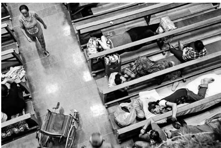
Iraki menekültek húzódnak meg egy templom padjai között

államfő korrupció gyanúja miatt került nyomás alá, Kína vezetői is nemzeti vallásosságról beszélnek. Egyre több ázsiai országban lehet észlelni azt a közös trendet, hogy a vallás és az államhoz való hűség kéz a kézben jár. Így például Srí Lankán a teljes értékű állampolgár természetesen buddhista. Az „igazi” malájnak pedig muszlimnak kell lennie. Az egyetlen kivétel ebben a térségben a többségében katolikusok lakta Fülöp-szigetek alkotják.