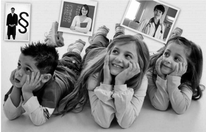
Mi leszek, ha nagy leszek?

Ha azt hisszük, miénk a jövő, akkor mindig van egy rejtkehelyünk, ahova a jelen terhei elől bármikor elbújhatunk. Ez a „mi lett volna, ha” vagy „mi lenne, ha” virtuális valósága, pontosabban valótlansága. Az álmodozások, illúziók, fikciók és fantáziák világa, az ideológiák és utópiák felségterülete. Elodázó életmódunkhoz e jövővel kapcsolatos téveszménk szolgált