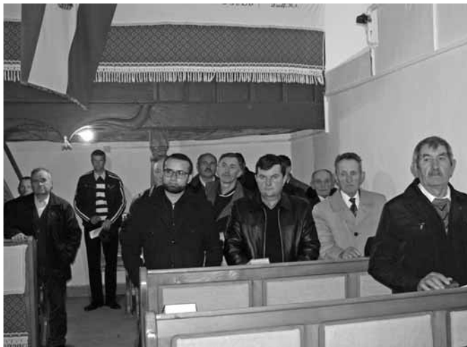
A presbiter Isten szolgálatában áll, nem emberi érdeket képvisel

ház érdekében él és dolgozik, azt Isten majd számon tartja” – fogalmazott Kerékyártó,