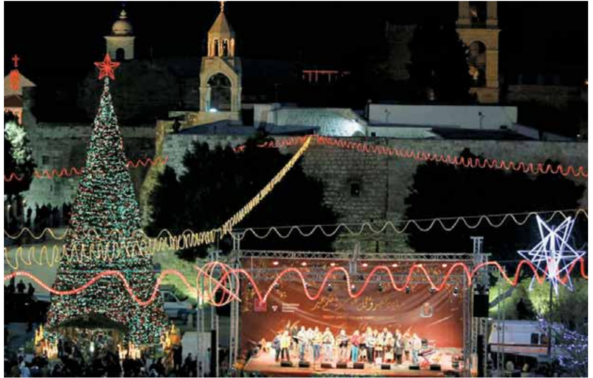
Karácsony Betlehemben. Turisták százai látogatnak Izraelbe decemberben