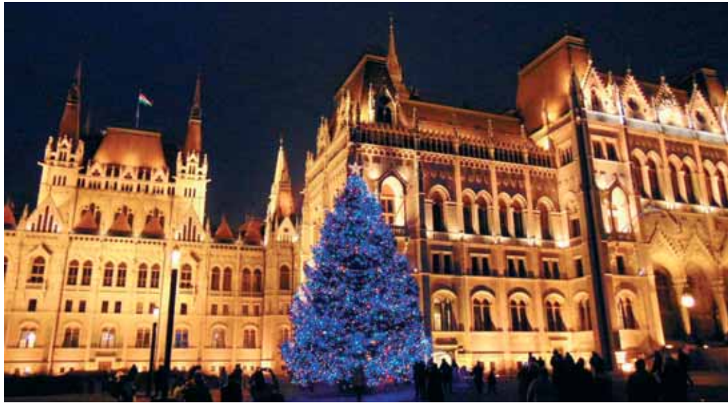
Az ország karácsonyfáját idén egy Fejér megyei család jóvoltából állították fel a Parlament előtt

Karácsonykor tehát el kell indulni. A megszületett világosságot nem szabad véka alá rejtetni, ám kár volna olyan szélnek kitenni, amely eloltaná. Vinni kell, hogy megmutassuk, máskor vinni kell, hogy menekítsük, és őrizni kell úgy, hogy megoszthassuk. A Mester nem véletlenül választotta szolgálata jelképéül a világosságot: minél inkább megosztjuk, annál nagyobb, minél többször adunk belőle, annál erősebb lesz. Mi-