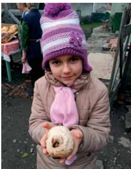
A süteink nagyon örvendenek a gyerekek

Ezelőtt hetven évvel a szórakozás sem maradt el. Az ünnep minden napján bál volt, ami