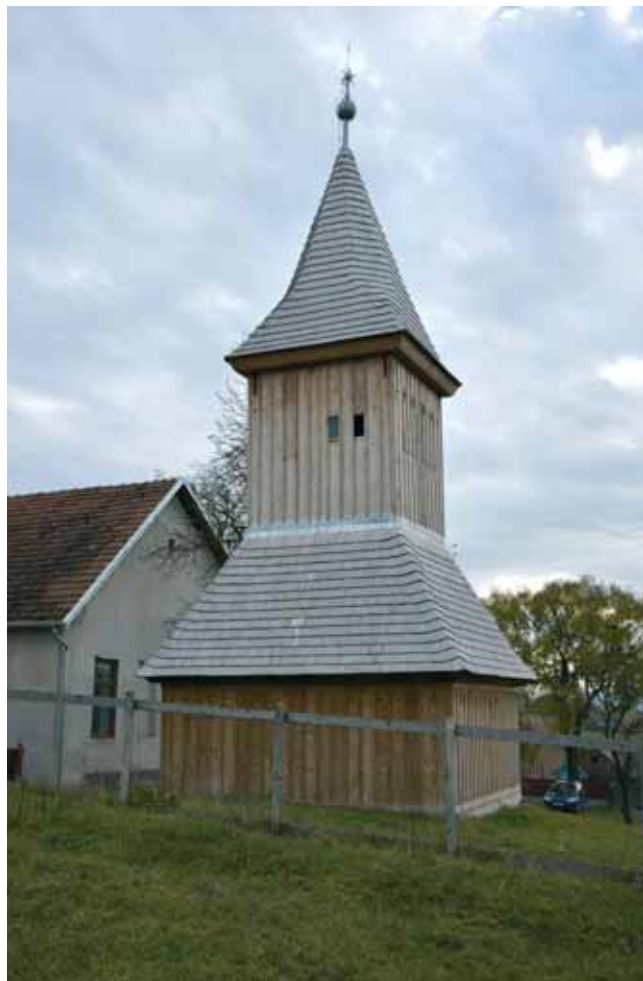
A megújult toronyban a harangzúgás másként hallatszik

Madarasifeketén a helybeli hívek és a vendégek ünnepelni gyűltek össze a közelmúltban: teljesen felújították a templomukat és a haranglábat. Az elmúlt kilenc évben folyamatosan javítottak, először a kerítést sikerült rendbe tenni,