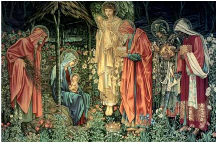
Sir Edward Burne-Jones: Királyok imádása (1887)

ígéretei beteljesültek. És arról, hogy ilyen az ember: vak, magát hajszoló, önmaga körül for- gó, mint a betlehemi világ. De ha Isten angyala a mennyei szózatot keresztül megéri a kő- bölcsőt, akkor az királyi trónussá változik. Lelki ámulások, gyönyörű látomások szülehetnek a