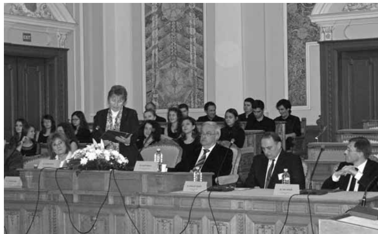
Reformáció 500: megújulás nélkül nincs fejlődés

európai, ezenbelül pedig a magyar kultúra megkerülhetetlen részévé vált. Ma már evangélikusok, reformátusok, unitáriusok és katolikusok, hívők, ateisták és kereső emberek közös öröksége az a kulturális for-