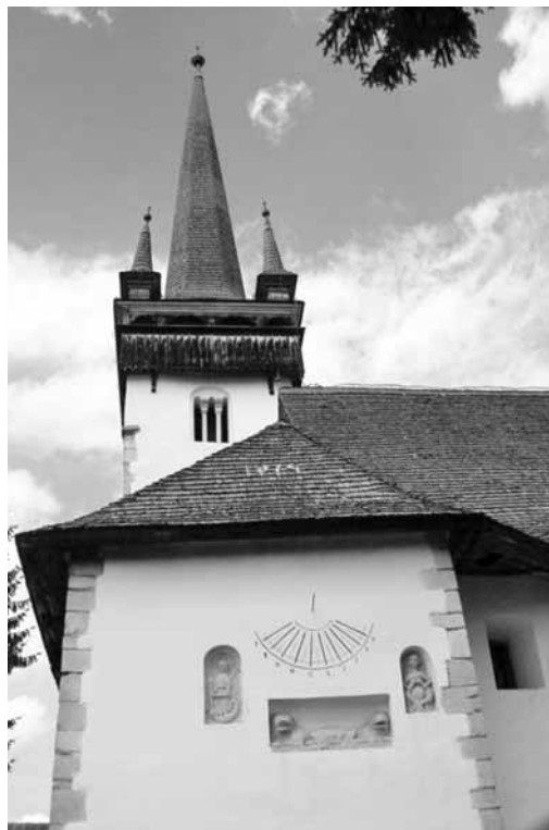
A magyargyerőmonostori református templom