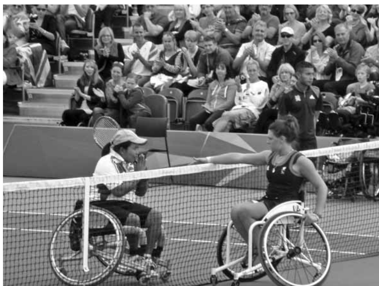
Namaste – köszönet a Fennvalónak

Egyébként az idei riói paralimpia megnyitójának a legmegrázóbb pillanata az volt, amikor a paralimpiai lángot rendkívül lassan vivő versenyző lángostól a földre huppant, majd a hatalmas stadionnyi tömeg biztatására magától felállt, és ugyanabban a tempóban, de megtette a neki szánt felpályányi távot. Leírhatatlan érzések, csodálatos hangulatok, felemelő pillanatok!