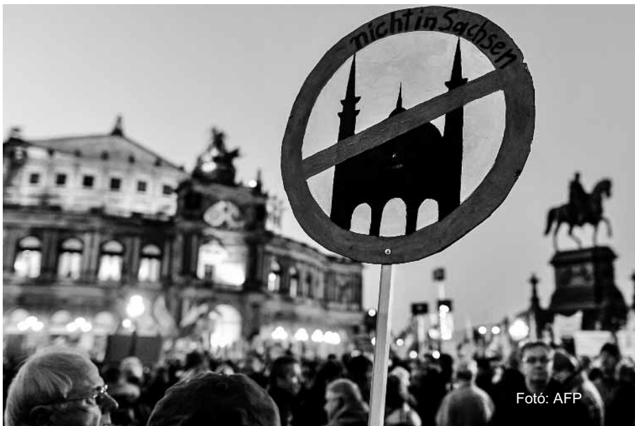
Németországi tüntetés a mecsetépítés ellen

század kifejezetten magyar protestáns teológusai az akkori iszlám hódítást, a törökvilágot Magyarhonban értelmezték. Ez ma is elgondolkodtató, és csaknem mindenben időszerű. Mivel meggyengült a kereszténység Európában, ezért engedte ránk Isten „Muhammedet”. Mert széthúzó, bálványimádók lettek sokan az akkori világban. Meg azért, hogy a hű kevesek révén az iszlámból áttérítsenek eleink minél több embert Jézus Krisztus boldogító ismeretére. A