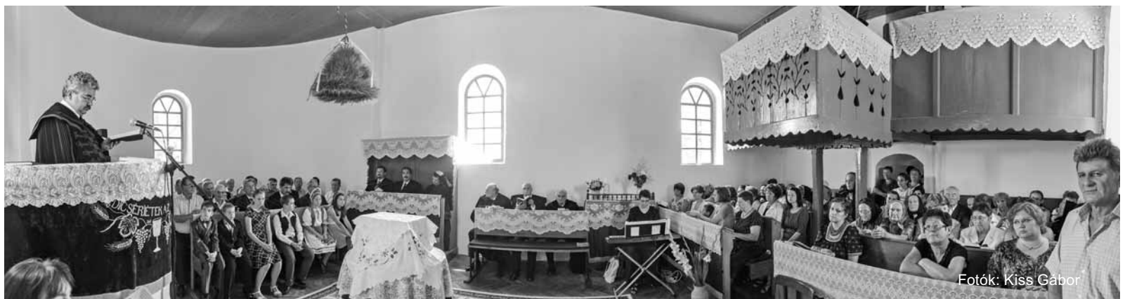
Fotók: Kiss Gábor