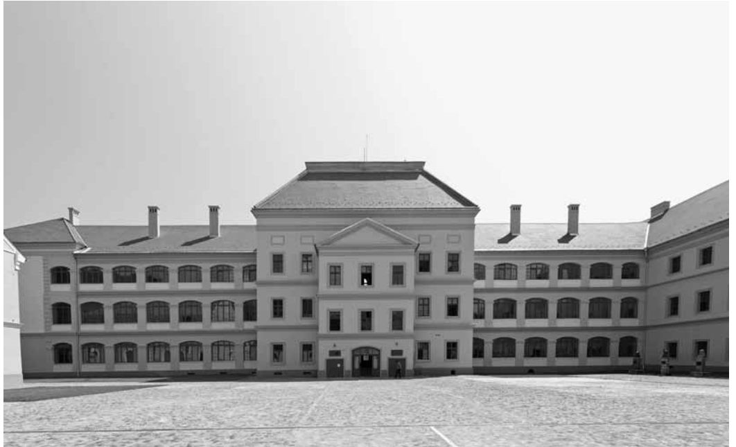
A nagyenyedi Bethlen Gábor Kollégium felújított épülete. Az őszi alma materben tartják szeptember 17-én a Kárpát-medencei református tanintézetek közös évnyitóját