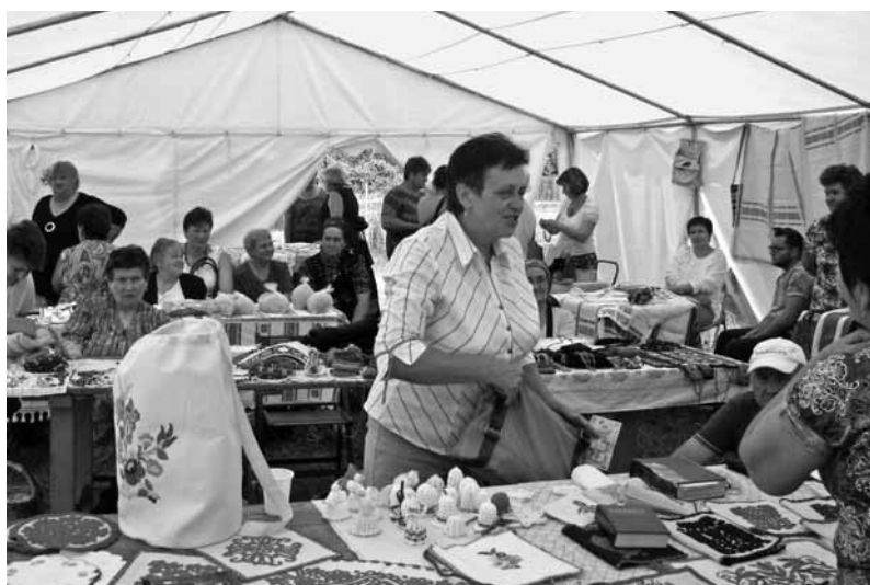
A sátrakban érdekes kézműves tárgyakat lehetett vásárolni