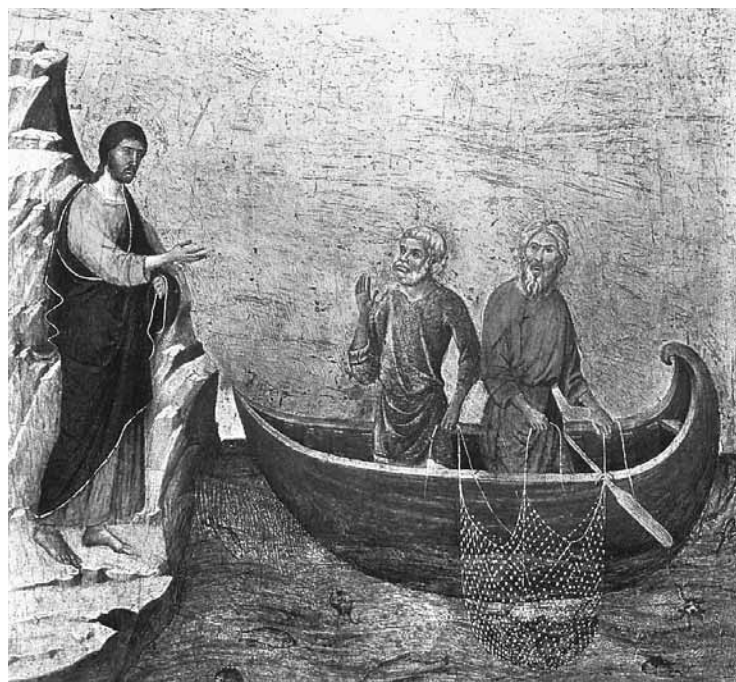
András és Péter elhívása

El lehet-e veszíteni az üdvösséget? Isten Igéje sok helyen határozottan kijelenti: nem! Lk 22,37-ben Jézus azt mondja Péternek, imád-