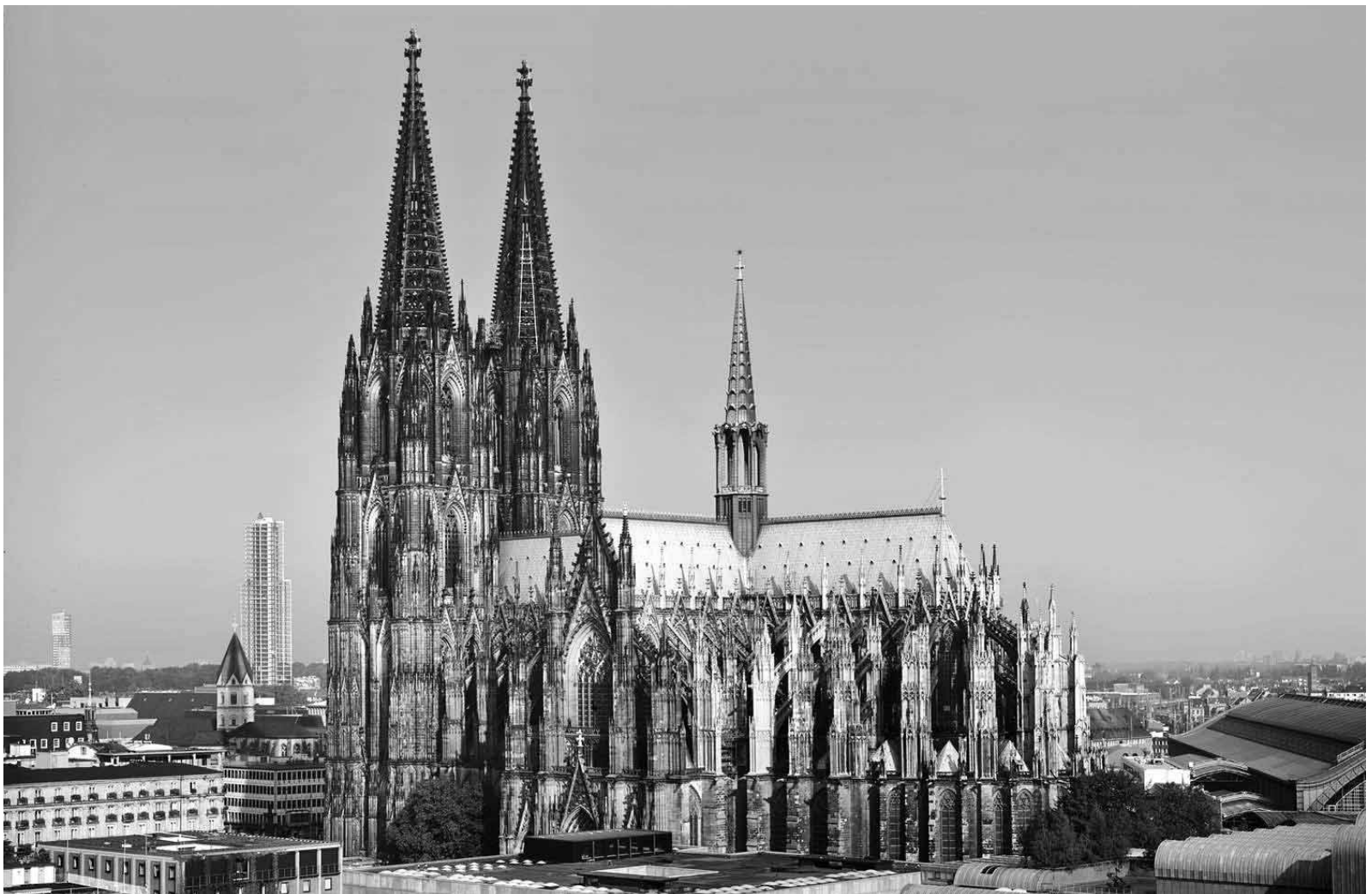
A kölni dóm Németország és Európa egyik legszebb keresztyén temploma. Vajon hányan járnak rendszeresen imádkozni a falak közé?

(a szerző a Dunántúli Ref. Egyházkerület főjegyzője)