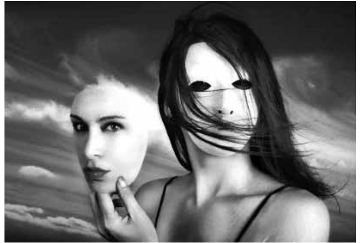
Vajon milyenek vagyunk? Isten belát az álarc mögé is

Isten ítélet helyett ébresztőt fúj Szárdiszban, és szolgálatba állít. Ébreszt látszatéletemből,