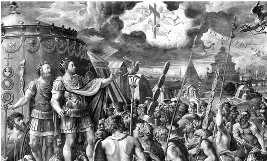
„E jelben győzni fogsz!” – mutatja fel az angyal Constantinus császárnak a keresztet

Mondja ezt az Európai Bizottság alelnöke egy emberi jogokkal foglalkozó kollokviumon. Meglepő fordulat, valljuk be, hiszen eddig a fatalizmus nem szerepelt még az emberi jogi ideológia kellékárkában. Vagy csak én nem vettem