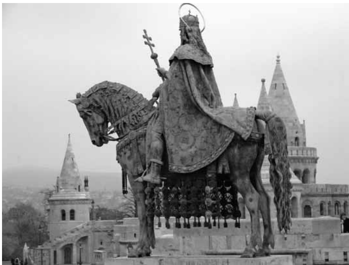
Szent István lovasszobra a budapesti Várban

„Magyarnak lenni nem állapot. Magyarnak lenni magatartás!” Az ezeréves magyar államra