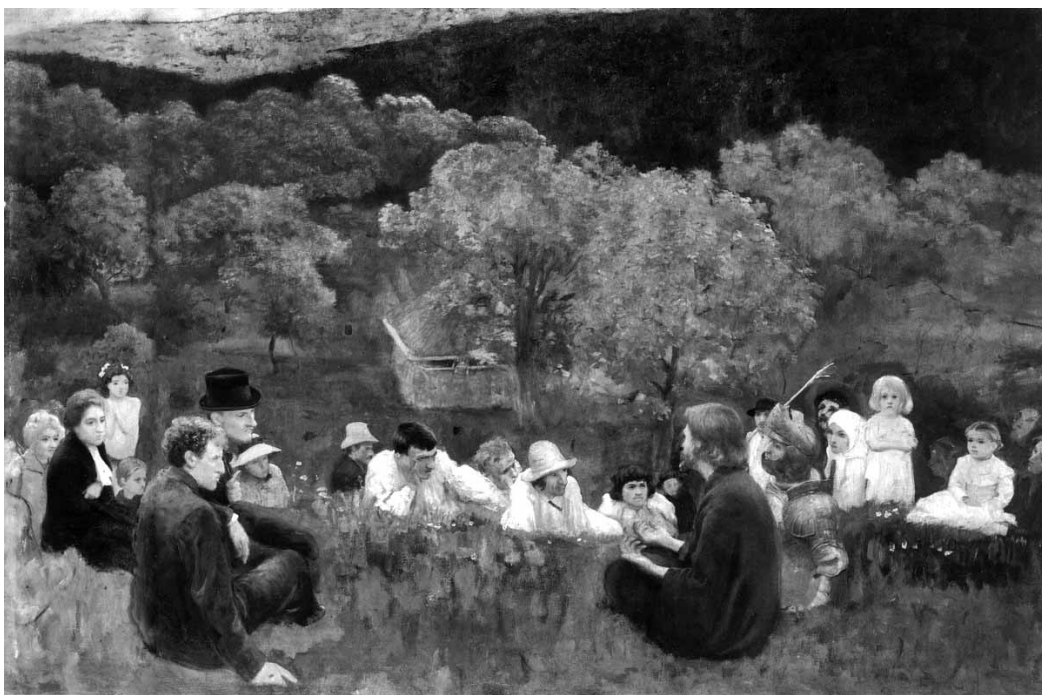
Ferenczy Károly: Hegyi beszéd

Mert tiéd az ország, a hatalom és a dicsőség mindörökké! – És mert hinni akarunk hitünk, munkánk, hétköznapijaink értelmében, a népek és népünk, megszenvedett tulajdonú hazánk országnyi és európai emelkedésében, ránk törő idegen talpasok vándorlása közben is, s Európa meggyengült keresztyén hitének felgerjesztéséért, új reformációiért kiáltva, teljes szívvel, reménységgel valljuk: Tiéd, s hű magyarjaidé, ne pedig másoké legyen az ország, a hatalom és a dicsőség Kárpát-medence Hungáriájában, Székelyföldtől a felvidéki havasokig, Verecke hágójától Felsőöregig. Ne a pártütőké, idegen érdekek szerencsevadászaié, keleti zsoldosoké, nyugati béreseké, s ne az egyéni haszonszerzésből országot árulóké és hazárdíróké. Így várjuk és munkáljuk a te országod növekedését közöttünk, s ezért magunkat neked újra és újra felajánlva szeretnénk élni tisztuló és erősödő hazánk, házuk, egyházunk közösségében nemzedékről nemzedékre jó békességben. Evégre mondjuk el naponta a szívedben fogant Úri imát, s mindent bizalommal neked, igazabb, igazságosabb, élhetőbb földi és magyar jövőt hozó, irgalmas és szerető Atyánknak a Jézus Krisztus nevében, aki megtanított minket így imádkozni a Lélek által. Ámen.