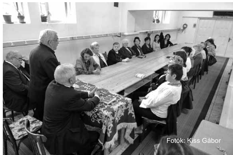
Fotók: Kiss Gábor