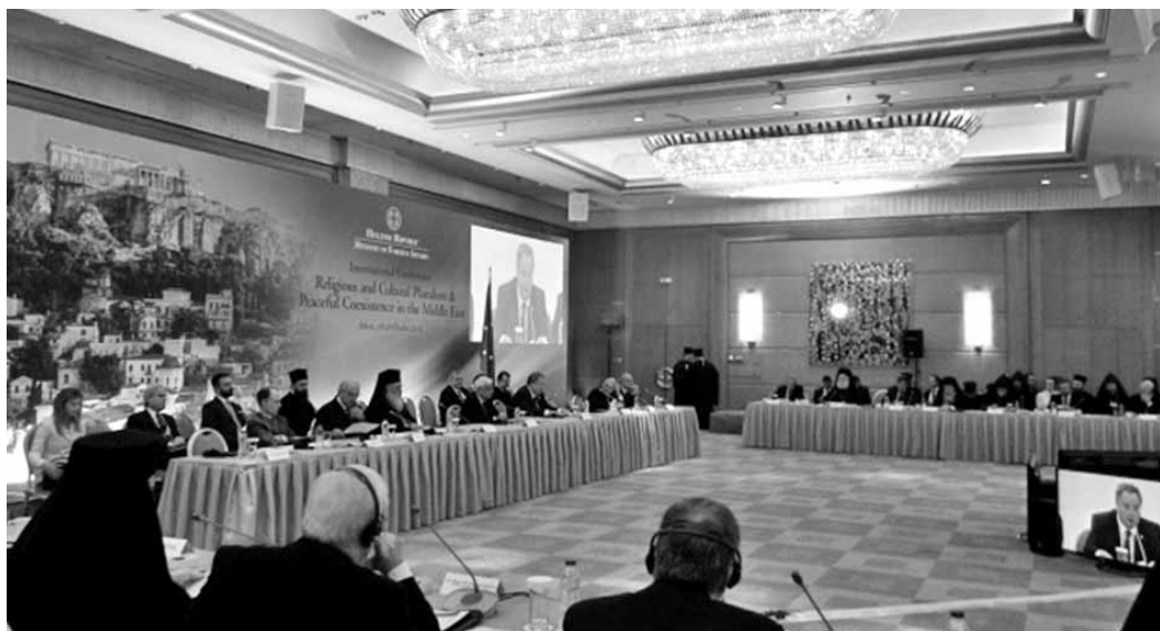
A közel-keleti válságról tartott nemzetközi konferenciáknak eddig nem volt sok eredménye