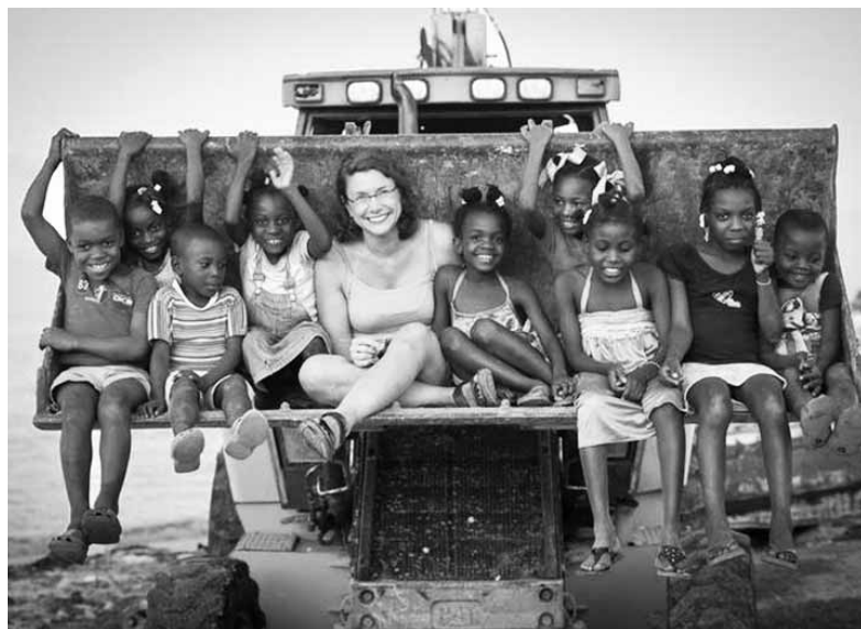
A könyv szerzője nemcsak a Közel-Keleten, hanem az afrikai kontinensen és Haitin is sokat segített a hátrányos helyzetűeken