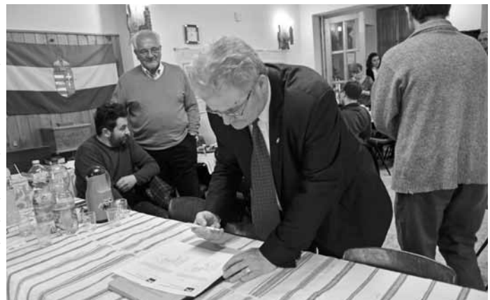
Istentisztelet után került sor a megállapodás ünnepélyes aláírására