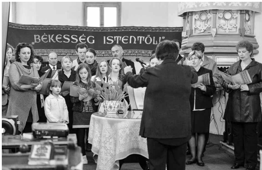
A megemlékezésen a hidelvei vegyeskar műsora színesítette a programot

Kolozson beindította a felekezeti iskolát, az ifjakat és gyülekezeti tagokat bibliakörökbe szervezte, körzeti asszonykonferenciát és presbiteri találkozót tartott, télen kéthetenként vendég-igehirdetőket hívott a szombat esti és vasárnap délelőtti alkalmakra.