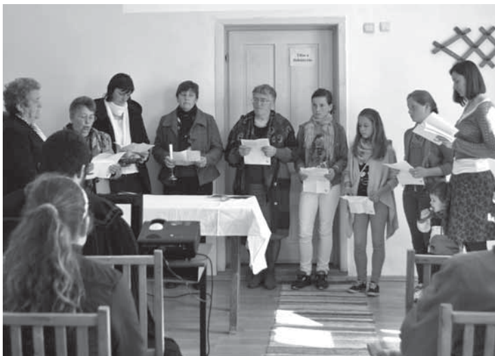
Az ikafalviak rendhagyó események szervezésével próbálják a református közösséget eggyé kovácsolni