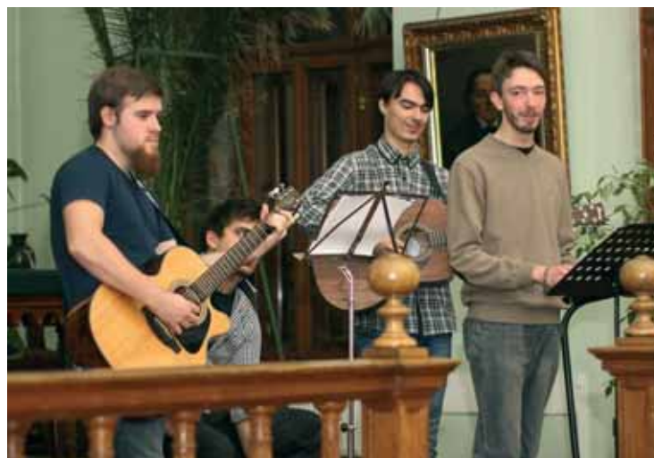
Az ünnepségen a LoveWood zenekar szórakoztatta a jelenlevőket

dezvény- és ünnepségsorozat elejét jelentette, amelynek csúcspontja a nyári szovátai Váls irányt! elnevezésű ifjúsági fesztivál lesz, a végét pedig december 10-én a Várom az Urat adventi keresztyén zenefesztivál zárja.