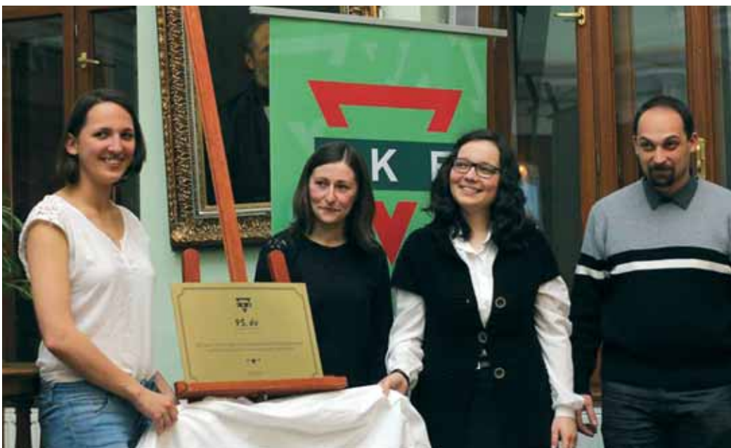
Az eseményen az ikés fiatalok emléktáblát leplezték le a szervezet 95. évére emlékezve

Az Ifjúsági Keresztyén Egyesület (IKE) megalakulásának 95. évfordulóját ünnepelték nemrég a Protestáns Teológiai Intézet dísztermében. Az ünnepségen felelevenítették a két világháború közötti időszak nehéz éveit, az ifjak útkereséseit, az 1990-es változások által adódott új lehetőségeket, és megszólaltak azok az ifjak is, akik az Erdélyi IKE elmúlt 25 évének elnökei voltak.