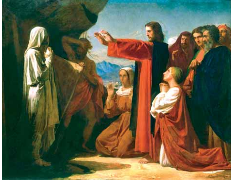
Leon Bonnat: Jézus feltámasztja Lázárt