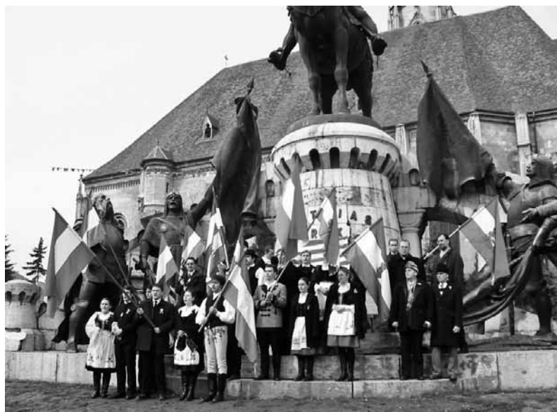
Kolozsvári fiatalok március 15-e alkalmával a Mátyas-szobor előtt (archív felvétel)

Persze a nemzeti ünnep lehet olyan nap is, amelyen egyszerűen csak kötelező szabadnap-pá silányul a szabadság megélése az emberi lélekben. Egy plusz nap a munkára vagy a pihenésre, kinek-kinek ízlése és habitusa szerint. De lehet akár a globalizmus piros betűs ünnepe is, melyen, ahogy jól megszoktatták már ve-