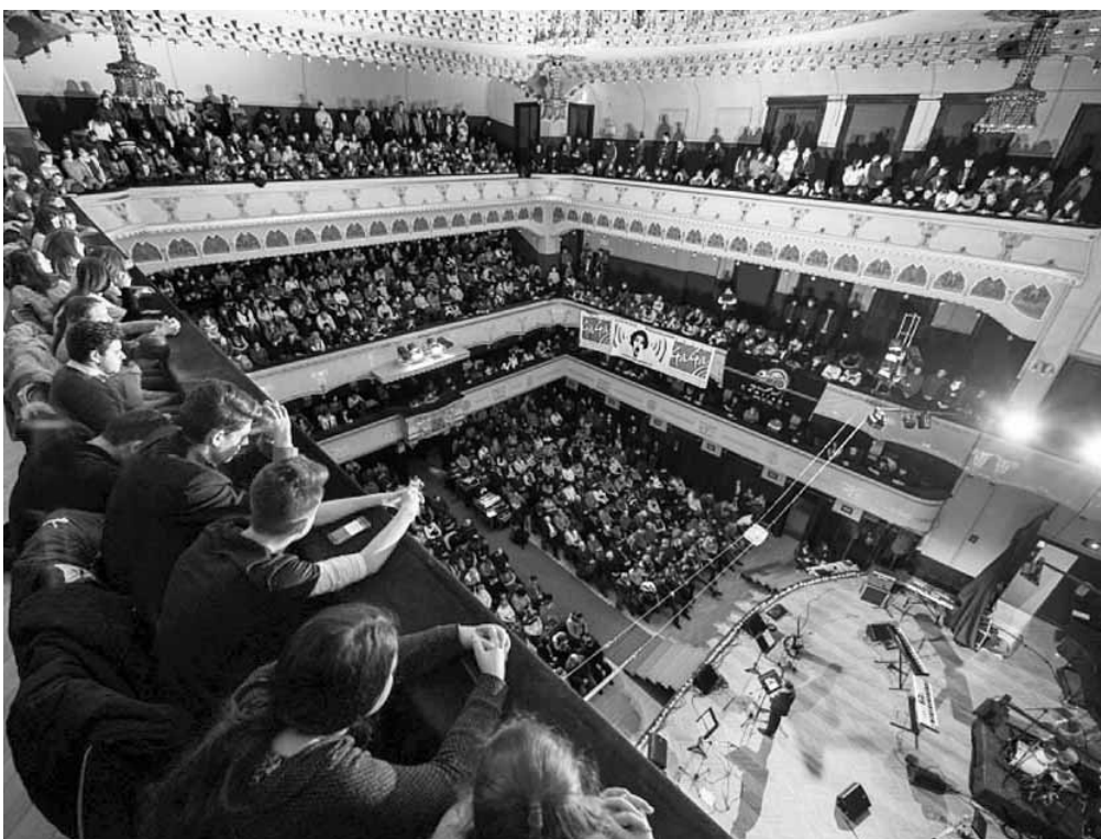
Hetedik alkalommal szervezték meg Marosvásárhelyen az Égjen a láng keresztyén zenefesztivált (képriportunk a 6. oldalon).