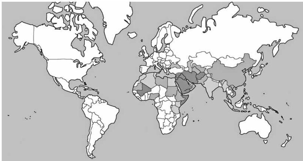
A térképen jól látható, hogy a keresztyéneket Közép- és Észak-Afrikában, valamint Ázsiában üldözik

Ha az első 20 helyezett között szétnézünk, meglepően sok a vallásüldözésben, az emberi jogok és a vallásszabadság alapjogának masz-