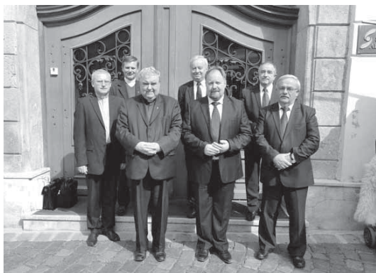
Az erdélyi magyar történelmi egyházak vezetői a Sapientia Egyetem kolozsvári székháza előtt