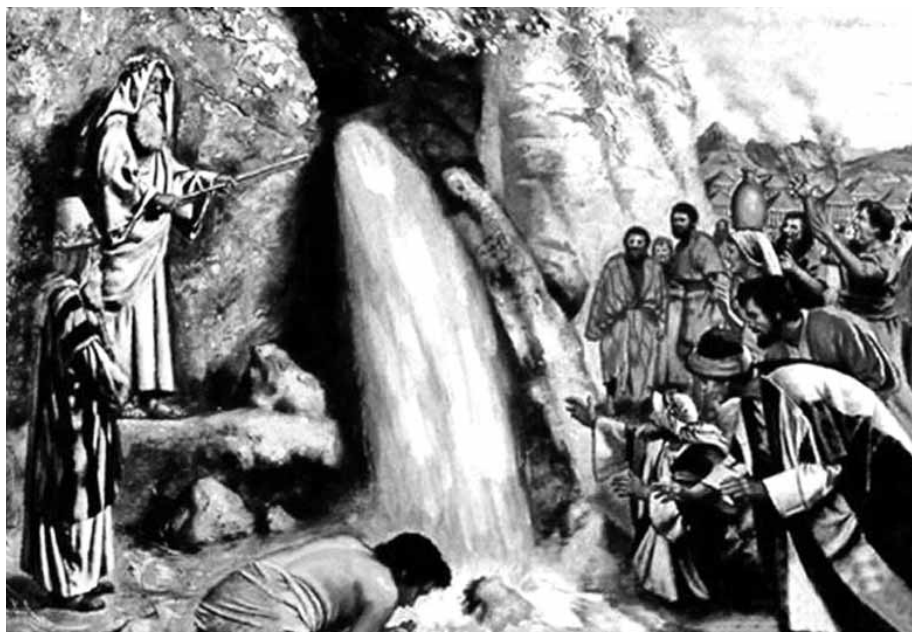
Vízfakasztás a pusztában Izrael népének

Szomorú, hogy Izrael szíve éppen e gondviselésben válik egyre keményebbé. A magam életében is megfigyelhetem, hogy éppen akkor hajlok el leginkább az én Uramtól, amikor asztalt terít elem a pusztában. Miért van ez így? A sötétség hatalma újra és újra elhitheti velem, hogy Isten áldásai voltaképpen az én ügyességem és nagyságom szerzeményei. Az én érdemem, ha jól alakul az életem, engem dicsér mindez. Az elbizakodottság pedig istenkísértésbe torkoll. Pusztai vándorlásában így bukik el a nép, s telhetetlenül újabb és újabb kívánságokkal áll elő. Az Ő kegyelme, hogy még nem ítélettel válaszolt sürgető szavaimra, hanem újra és újra asztalt terített nekem a pusztaságban, minden szükséges dologgal ellátva életemet. Bűnvallást kereső és halált mondó szívvel keresem az Ő közelségét, dicsérve szent nevét szerető gondoskodásáért.