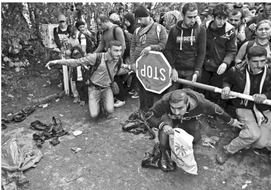
Az afrikai és ázsiai menekültek száma nem apad

A Biblia nemcsak vallásosságot, hanem hit általi életek, viselkedések sorát tárja elénk. Egyházi és nemzeti múltunk pedig a családban gyökerezett, és a munkára, igazságosságra alapozhatta erkölcsi fejlődését ezredéven át.