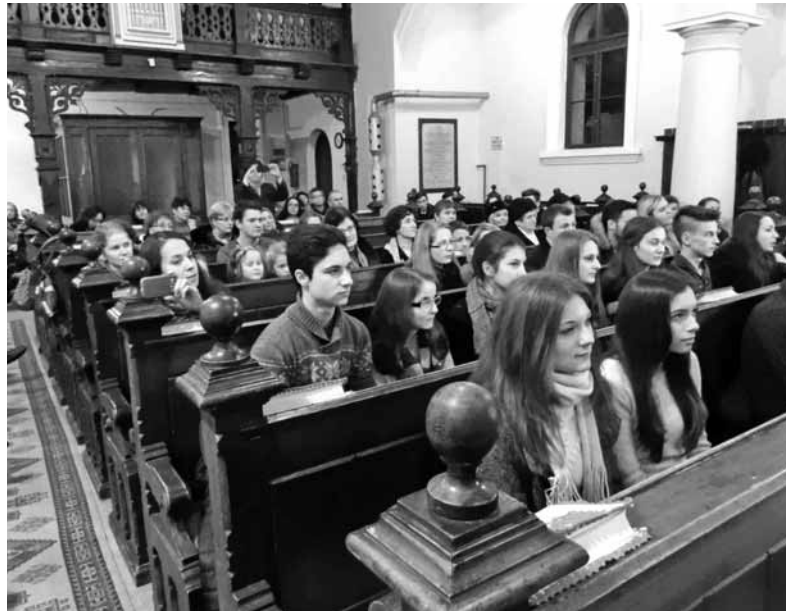
Segesváron a fiatalok otthon érzik magukat a templomban

az Úr asztalát, hogy szerepelni tudjunk karácsonykor. Amikor ott kívántunk egymásnak boldog karácsonyt. Amikor barátainkkal együtt vettük az úrvacsorát. Amikor az úrvacsora alatt