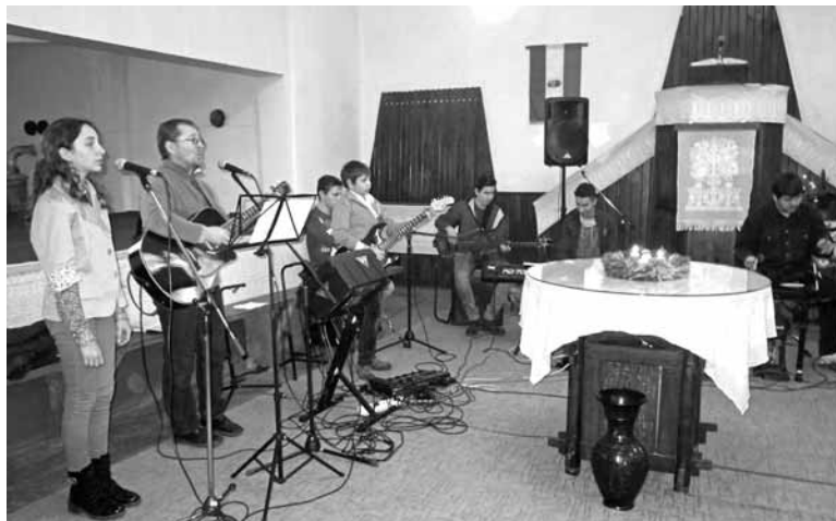
A zenét a szászrégeni Mini Sófár együttes biztosította