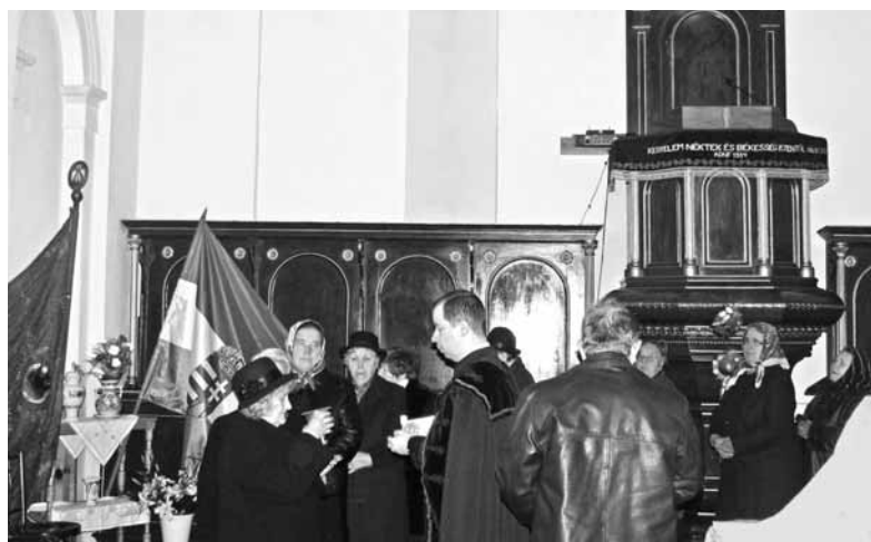
A hálaadó istentiszteleten kiosztották az Úr szent vacsoráját