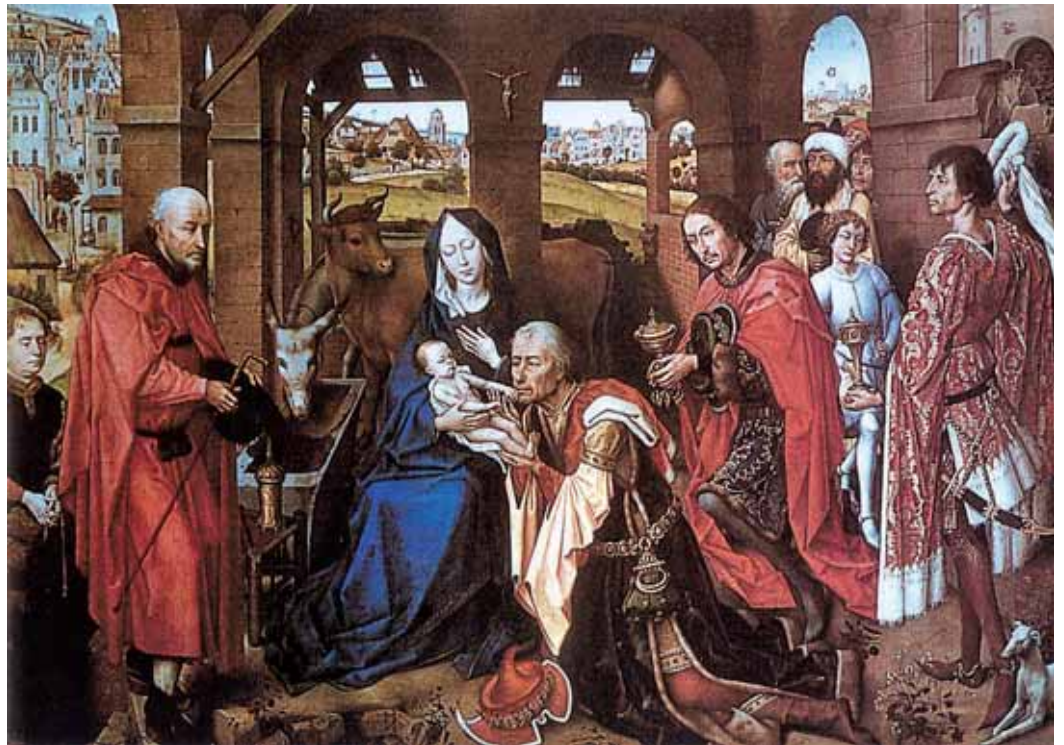
Rogier van der Weyden: Napkeleti bölcsek