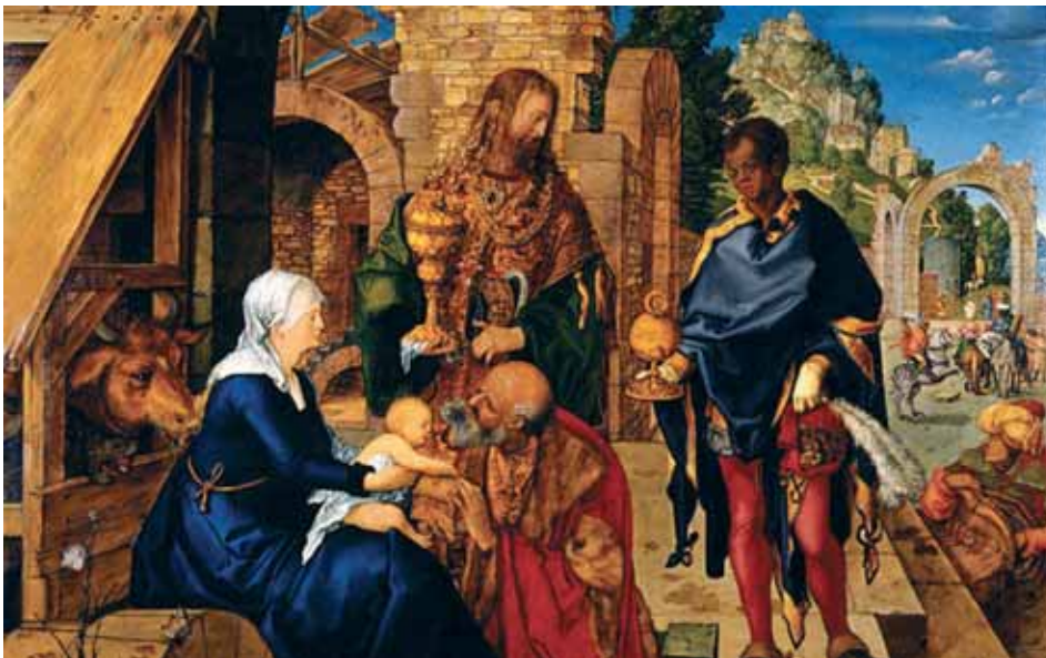
Albrecht Dürer: A háromkirályok imádása

juk haszontalannak és értelmetlennek. Ilyenkor is igaz, hogy a negatív adat is adat: ki kell lépni, tovább kell lépni, mert ott, abban a helyzetben nincs jelen Jézus, másutt kell keresni. És lehet, hogy éppen ilyenkor tudjuk meg, hogy hol van az a másutt. És ha van erőnk lépni, változtatni, a csillag a mi fejünk fölött is felragyog.