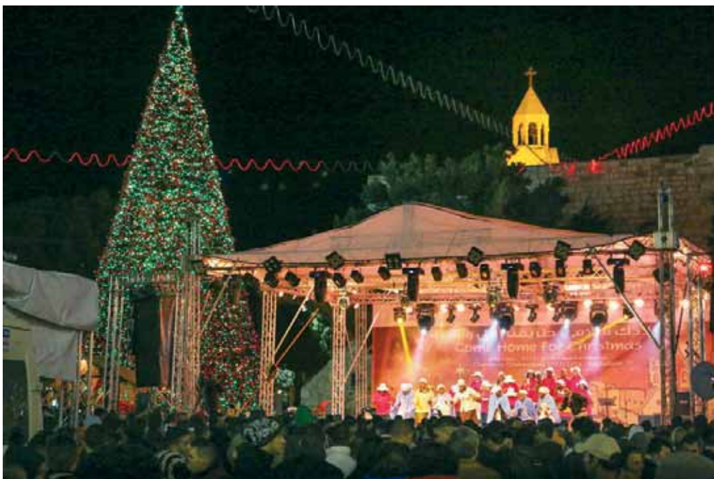
Karácsonyi sokadalom az izraeli Betlehem városában a 21. században