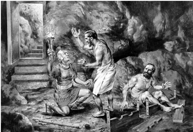
Pál és Silás a börtönben is hirdetik Isten Igéjét

Isten szabadító munkáját nehezen viseli el, sőt egyéni sérelemként fogja fel az önmagára figyelő ember. Ez előbb közbotránnyá dagad, majd politikai ügyet kreálnak belőle. – Szegény Pál! – ébred bennünk a részvét. Miért nem ügyelt, hol és mit mondhat, meddig mehet el?