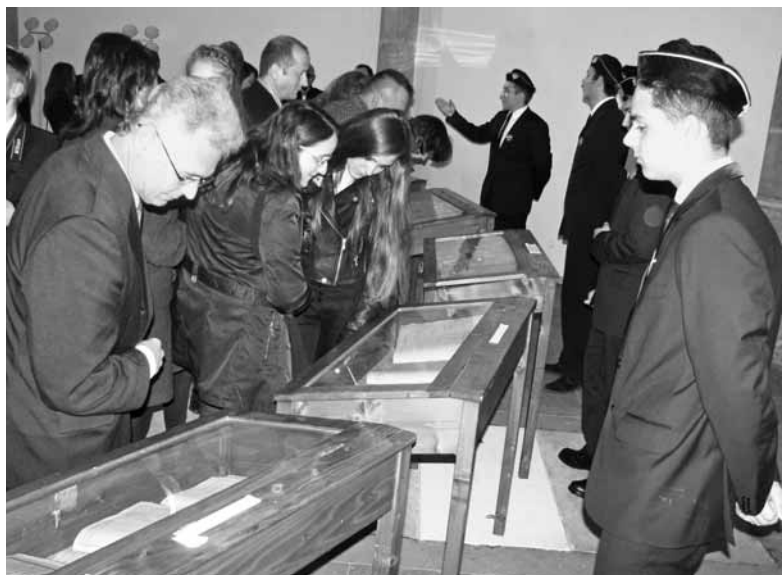
Múlt és jelen. A kétnapos rendezvénysorozat alkalmával iskolatörténeti kiállítást szerveztek a Farkas utcai templom szentélyében