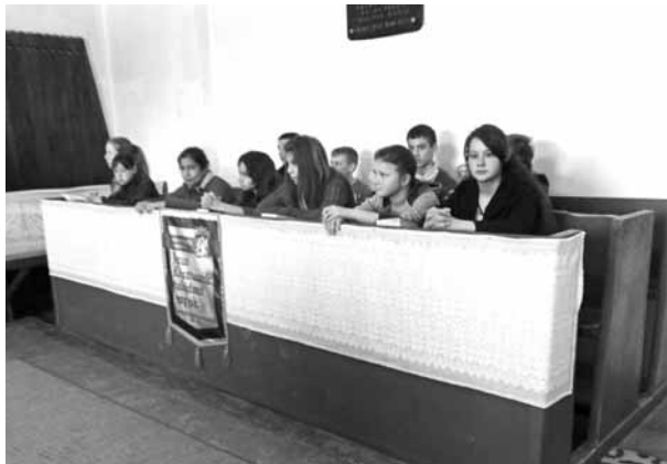
Balavásári fiatalok a templompadban

Szép és elgondolkodtató eseménynek vagyok tanúja, amint az istentisztelet végén hozzák be a kislányt a keresztre. Öt fiatal pár áll az úrasztala mellett egy kisgyermek keresztelésénél majdnem feltűnően modern öltözetben. Számomra azért is feltűnő, mert Marosvásárhelyen egyre gyakoribb az olyan keresztelés, amikor a kisgyermeken, a szülőkön és a keresztszülőkön népviselet vagy „magyar ruha” látható. Itt a „legutolsó módi”. Később tudom meg: egy részük külföldön – Nyugat-Európában – dolgozik. Profi videós filmezi, és egy másik fényképezi hozzáértéssel, nem zavaróan az egész szertartást. Ennek a