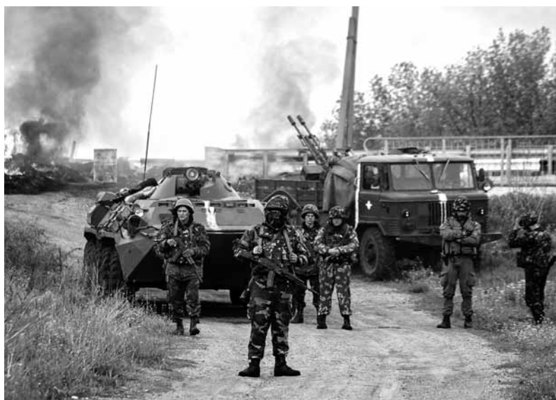
Tőlünk keletre egyre keményebb harcok folynak Ukrajnában. Egyre több a halott, köztük kárpátaljaiak is. Az eddigi több ezer halott miatt még senki nem szervezett tiltakozó nagygyűlést