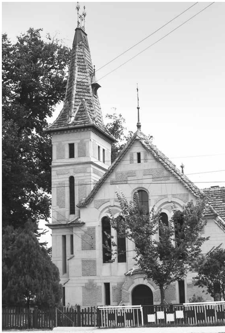
A segesvári református templom főhomlokzata

Templomainak egy része olyan nagy történelmi múltú városokban épült, ahol az evangélikus szászok voltak jelentős többségben, a reformátusok pedig kisebbségben. A templomok másik része Dél-Erdély szórványának számító missziós egyházközségeinél kisebb lélekszámú településeken található. Legnagyobb és legkarakteresebb templomát, a brassóit 1962-ben a román hatóságok lebontásra ítélték, helyén azóta szálloda áll. Az építész utolsó református templo-