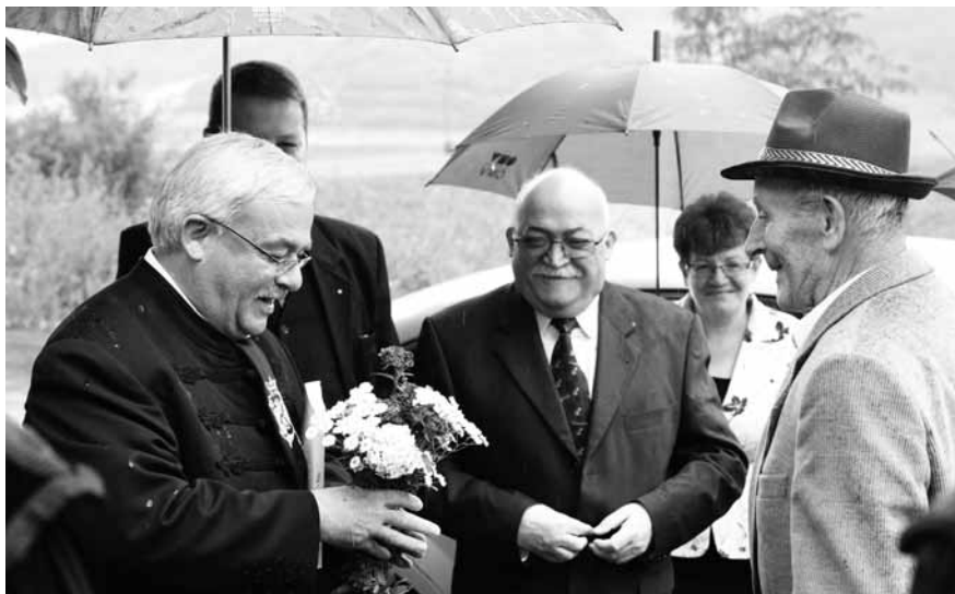
A vizitációk a rossz idő ellenére is mosolyt csaltak a résztvevők arcára

– Távoltságban kifejezve 75 000 km-t autóztam. Számos olyan helyen fordultam meg, ahol korábban én sem jártam, vagy ahol évtizedek, évszázad óta nem járt püspök. Szerintem fontos volt ilyen közösségekbe is ellátogatni, mert a gyülekezetek érezhették: az egyház nem feledkezett meg róluk, és a felmerülő gondokban próbál segíteni. Sikeres volt a vizitációs