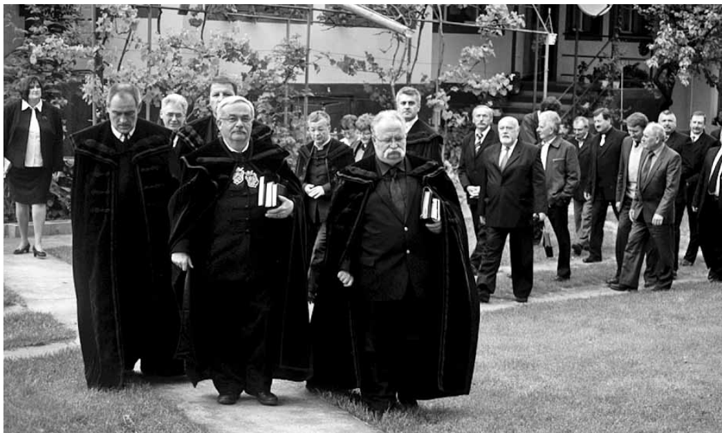
A vizitációs bizottság tavaly Erdély több településén is megfordult

– Igen. Úgy vélem, ha a külső feltételek hiányoznak, a belső építkezés is paratlaná válhat. Tavaly az egyházkerület néhány kolozsvári épületén jelentős javításokat végeztünk: megújult a Püspöki Hivatal, a Magyar utca 1. szám alatti ingatlan egy része, a Bocskai téren elkezdtük az egyházi múzeum és levéltár, valamint a sajtóközpont kialakítását. A legfontosabb azonban az egyházi szakoktatás beindulása volt, ehhez a magyar kormány segítségével a hidelvei templom szomszédságában egy korábban visszakapott, egykor Szász Domokos püspök által építtetett ingatlant újíttottunk fel. Ez volt talán a legfontosabb kezdeményezés: a fiatalokkal foglalkozunk, bennük látjuk a jövőt, szakmát adunk a kezükbe, hogy próbáljanak szülőföldjükön boldogulni.