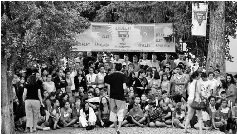
A fiatalok összetartásában nagy felelősség hárul az IKE-rendezvényekre

hogy az alkalmakon figyelik a gyanús résztvevőket, és próbálják kiszűrni, kiutasítani a tábor területéről azokat, akiket felismernek viselkedésükről. A magyarországi rendezvények nyitottak az erdélyi fiatalok számára, ezért gyerekeink és fiataljaink – mivel nem ismerik a magyarországi veszélyeket – kétszeresen ki vannak téve ennek. Vajon az IKE rendezvényein is vannak hasonlóak? Mennyi idő múlva jelennek meg nálunk is?