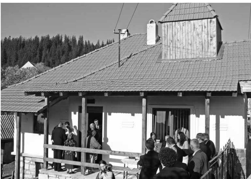
A Görgényi Egyházmegyééhez tartozó, Hargita megyei fürdővárosban, Borszéken a 44 lelkes közösség nemrég kis templomot épített. Fényképes riportunkban e maroknyi közösségről, de az őket támogató maroshévízi gyülekezetéről is írunk. Cikkünk az 5. és 7. oldalon