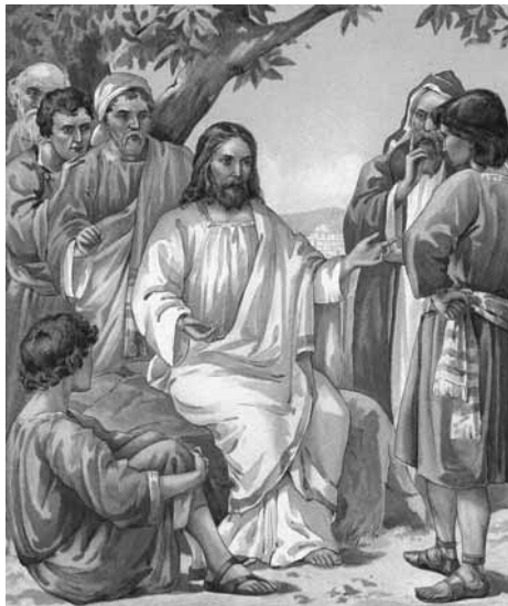
Ambrose Dudley: Jézus és tanítványai

szó. Ma is szükséges eljutni a hitnek alacsony fokáról arra a tapasztalatra, amelyet megkaphatunk, ha valóban felfogjuk, ki is volt Ő igazában: Isten emberi testben. Üdvözítőnk komolyan és kitartóan igyekezett előkészíteni követőit a kísértések viharára, mely minden percen rájuk támadhat.