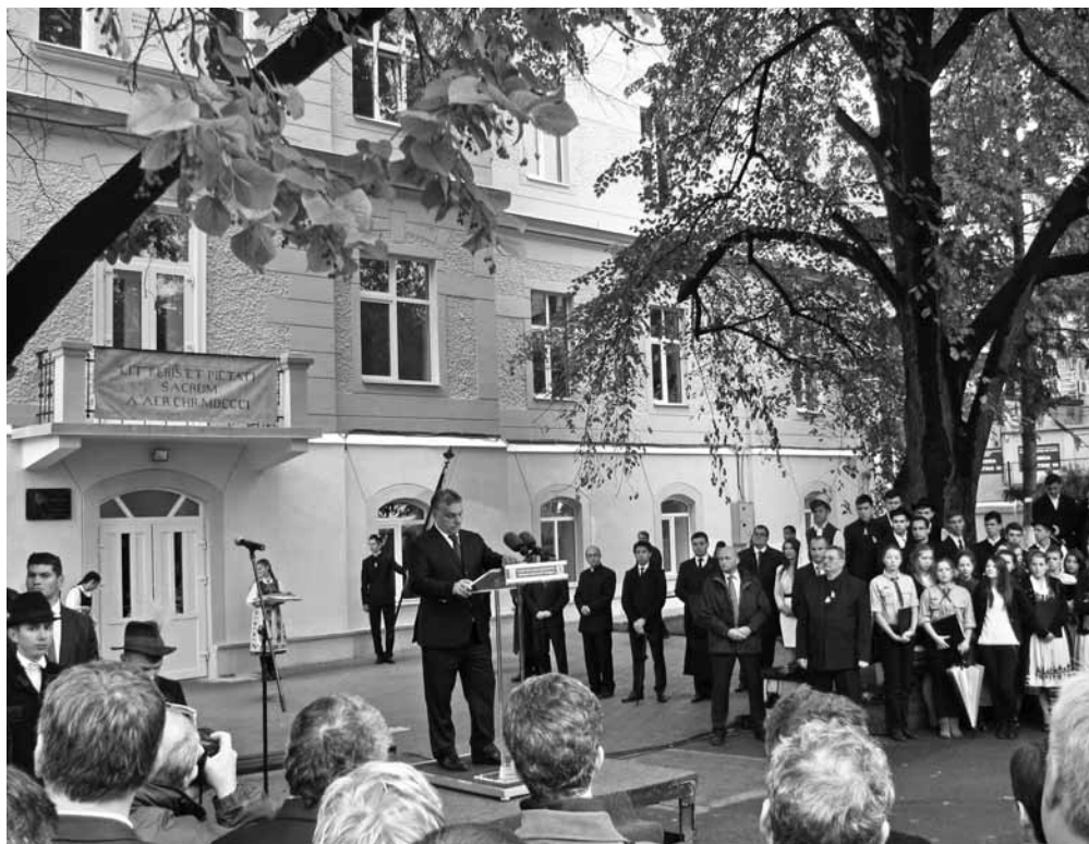
Október elején Orbán Viktor miniszterelnök jelenlétében avatták fel Erdély egyik legkorszerűbb szakiskoláját, amelyet a református egyház támogat. Összeállításunk az 5–6. oldalon