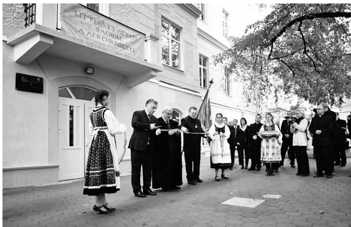
Nyerő hármast. Orbán Viktor, Kató Béla és Székely Árpád átadják a református szakiskolát

„Laboratóriumi szerepet szánunk a kolozsvári kezdeményezés elindításának – vázolja elképzeléseit az egyházkerület püspöke. – Ha a modell működőképesnek bizonyul, Erdély más régióiban is kiterjesztjük, új szakiskolákat, szakliceumokat hozunk létre.” Az elmúlt 25 évben Erdélyben a szakoktatás sérült a leginkább. A kommunizmusban mindenki azzal riogatta a gyermekét, hogy szakiskolába fog kerülni, ha nem tanul. Mert oda csak a semmirekellők, buták jutnak – vallották a szülők. A '90-es évektől ezért mindenki egyetemistát akar faragni csemetéjéből, ez pedig óriási problémája a társadalomnak. Eltűntek ugyanis a szakemberek. Az egyetemi képzés túlburjánzása következtében