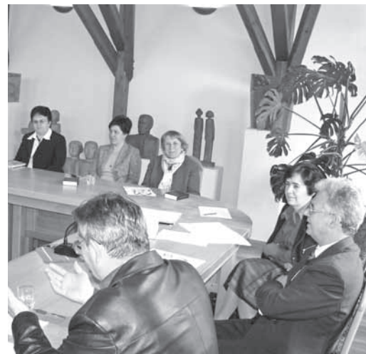
A tanácskozáson elhangzott: az egyházzene terén sok a tennivaló

Egyházkerületünk egyházzenei előadói május 8-án immár második alkalommal találkoztak.