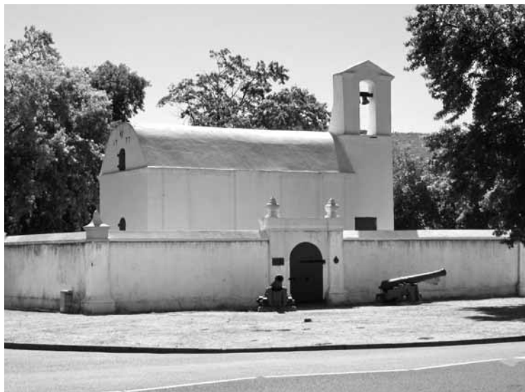
Fehérré meszelt keresztyén templom a 18. századból

munkaerő a közbiztonság kritikus állapota miatt. A korábbi helyzet a visszajára fordult, a többségi fekete lakosság egyre durvábban lép fel a kisebbségben lévő fehér lakosság ellen, annyira, hogy egyesek szerint szabályszerű népirtás zajlik Dél-Afrikában.