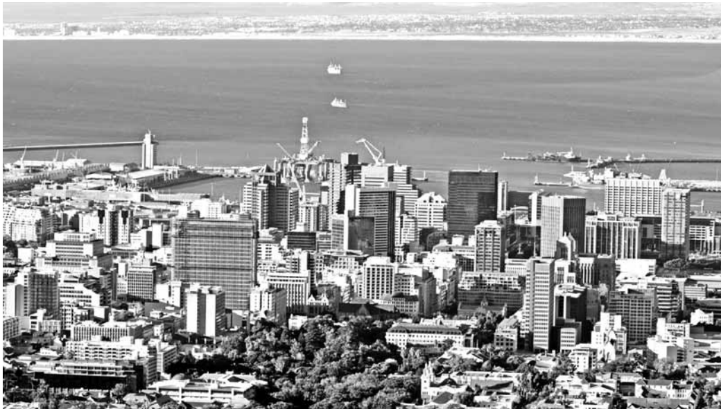
Cape Town (Fokváros). A pompás látvány senkit se tévesszen meg: a szegénység egyre nő

Mára azonban egyre többen – köztük feketék is – nosztalgiával tekintenek vissza a sok szempontból nyomorúságos időszakra. Ennek elsősorban az az oka, hogy az apartheid utáni Dél-Afrikában az emberek milliói továbbra is szegénységben élnek. Korábban ritka volt a szegény a fehér emberek között. A számuk azonban nagyon megnőtt, így mi is sok fehér koldussal találkoztunk az utcákon. Egyre többen vannak olyanok, akik szerint a fennálló kormányzat rossz pénzügyi és költségvetési politikája az oka annak, hogy egyre egyenlőtlenebbül oszlik el a gazdagság, és a gazdasági növekedés eredményét kevesen élvezhetik. Az országot olyan – a lakosság által egyre keményebben kritizált – elnök ve-