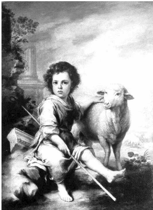
Bartolomé Esteban Murillo: A jó pásztor

A húsvét és pünkösd közötti harmadik vasárnap neve: Jubilate . Ennek a neve ujjongásra, kiáltásra, vigadozásra, zengedezésre, örvendezésre utal. Engem Isten meg akar örvendeztetni Jézus Krisztusban véghezvitt üdvtervével. Az-