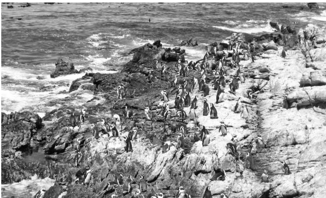
Európai szemnek szokatlan látvány: a tengerpartot pingvinsereg lepi el

A dél-afrikai angol nyelvűek többnyire az anglikán egyházhoz tartoznak. Mi dél-afrikai magyarokkal nem találkoztunk, csak magyarul beszélő turistákkal futottunk össze a Joreménység foknál. Az ország domborzata csodálatos: hegláncok, zöldellő, termékeny völgyek, félsivatagi tájak, hosszú óceánpart változtatja egymást. E tájakon hihetetlenül változatos állat- és növényvilág figyelhető meg, volt is részünk sok szép látnivalóban a szomorú képet mutató embervilág mellett. Aki teheti, látogassa meg ezt a csodálatos országot!