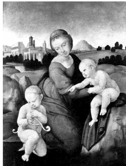
Rafaello Santi: Esterházy Madonna