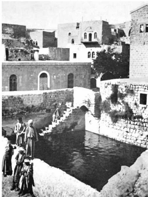
Az ókorban is használt vizes medence Hebron központjában (a felvétel 1937-ben készült)

Saul és Jonathán halottak, így Dávid előtt nyitott a királyság felé vezető út. De ő nem akar a saját feje után elindulni, hanem az Úrtól kérdezi, merre menjen. Isten ekkor Hebront jelöli meg, ami akkor papi város volt, híres ősök sírhelyeinek városa. Olyan hely, amely emlékeztetett Isten múltbeli cselekedeteire és ígéreteire. Ezért Dávid ott lesz király. Az a múlt, amiben Isten az előző nemzedékeket, de minket is ve-