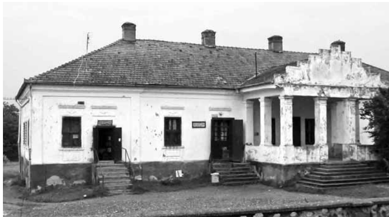
Az Apor-kastély a régmúlt időkre emlékeztet

Az 1700-as években Abosfalvát az altorjai Apor család birtokolta, s akkor épült a ma még álló, de egyre jobban romló kastély. 1870-ben egy impozáns fedett tornácot építettek a földszintes kastély elé, amely így épp a református templom-