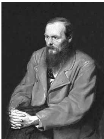
Fjodor Mihajlovics Dosztojevszkij

János azt a Jézust hozza szemünk, szívünk elé az Igében, a Szentlélek megjelenítő inspirációjában, akiben felfénylik, teljességében tündöklék fel Isten szépsége. Dosztojevszkij – akit mindenki olvastatni kellene a mechanikus internetvilágban – Jézus szépségét a gyógyulás és a megváltás eszközeként tekintette. Heinrich Böll ezért a Félkegyelmű c. regényt nevezte a világirodalom egyetlen igazi Krisztus-regényének. „A szépség menti meg a világot.” A szépség Dosztojevszkij számára a hasznosság ellentéte. Ha mindent a haszonelvűségnek vetünk alá, akkor elvész az emberi lényeg, az emberi méltóság. Eldobható dobozok leszünk a végzet kezében. Szépséglátás, szépségbefogadás, szépségélmény nélkül elvész az ember az apátiában. Jézus megváltó tetteinek egyike, hogy a szépséget beleülteti az emberi lélekbe. Az emberekbe ültetett szépség képes arra, hogy testvérekké formáljon minket. A zseniális orosz katortagjáró, bibliaolvasó szerint csak egyetlen pozitív és szép alakja van a történelemnek, Jézus Krisztus. És ez a végtelenül szép Krisztus maga az örök csoda.