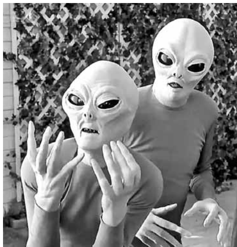
A földönkívülieket legtöbbször így képzelik el