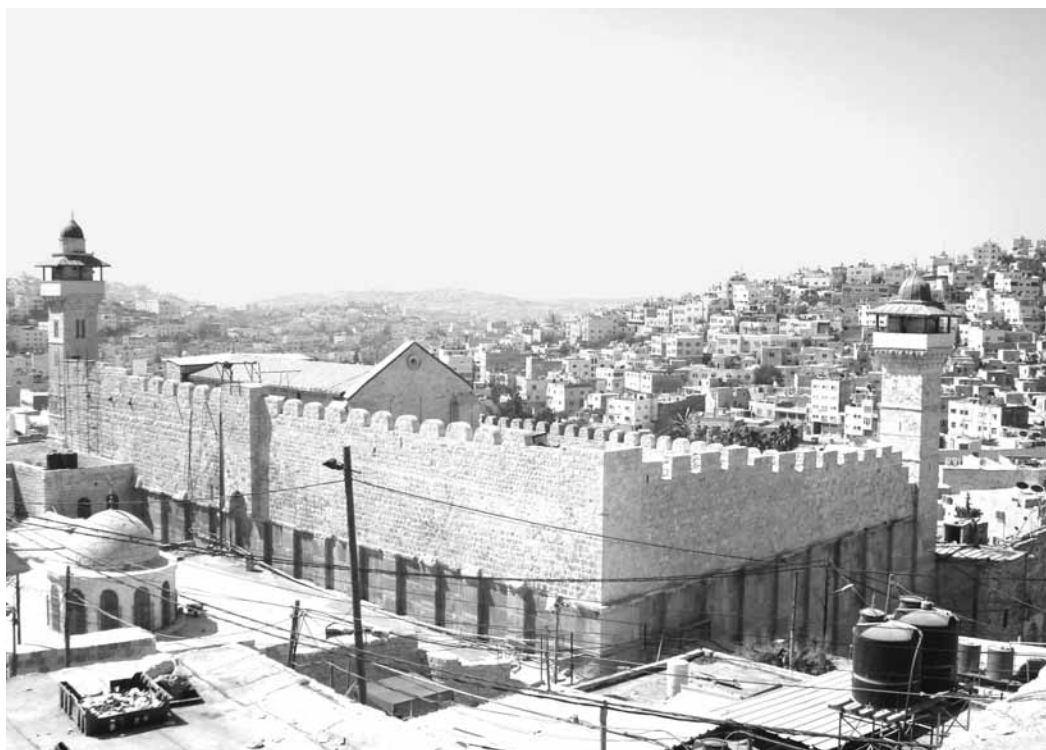
Pátriárkák sírja Hebronban. A város ma Ciszjordánia legnagyobb palesztin települése, Jeruzsálemtől kb. 30 km-re délre. Központjában mintegy 600 zsidó telepés él egy enklávéban a judaizmus és az iszlám által szent helynek tekintett pátriárkák sírja közelében, az izraeli hadsereg védelme alatt.