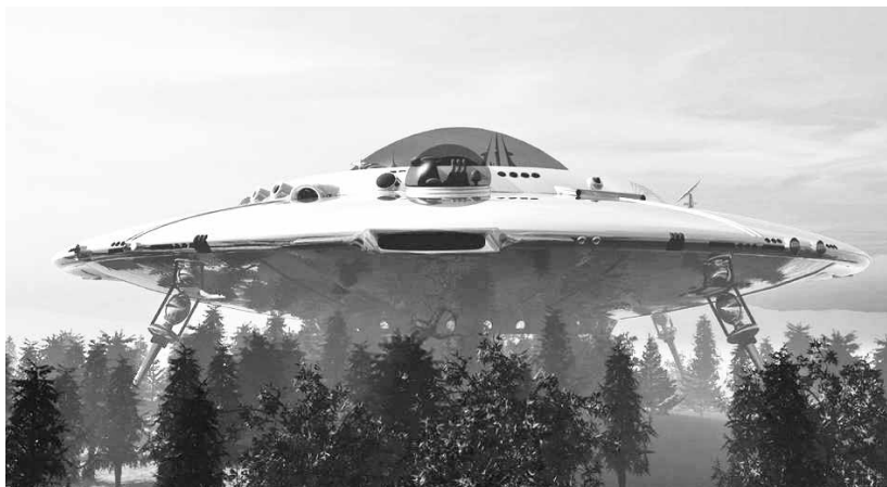
UFO az erdő felett. Jellemző ábrázolása a repülő csészealjagnak.