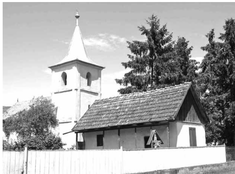
Az abosfalvi templom: egyre kevesebben keresik fel Isten hajlékát

A faluban álló görög katolikus fatemplom és az ortodox templom jelzi a románság jelenlétét. A mára megtanult együttélés szimbolikus képét jelzi a magyar református templom melletti háztáj kapun belüli ortodox keresztje. S ahogy megférnek ők tíz méterre egymástól – magyar református zsoldár és népi himzseses kendővel díszített román kereszt –, úgy élnek együtt ma Abosfalván az emberek, és remélik a szebb holnapot.