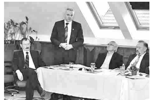
Zán Fábian Sándor: nehéz helyzetben vagyunk

A kárpátaljai viszonyokról Zán Fábian Sándor püspök elmondta: a megyében néhány ukrán nemzetiségű tisztségviselőn kívül mást eddig nem ért fizikai atrocitás az ukrán nacionalisták részéről. A bizonytalan helyzet és a nacionalista fenyegetés miatt Beregszászon és a falvakban is önkéntes őrző-védő szolgálatot szervez a helyi magyarság, amelyhez a közösség a református egyház segítségét is kérte. A