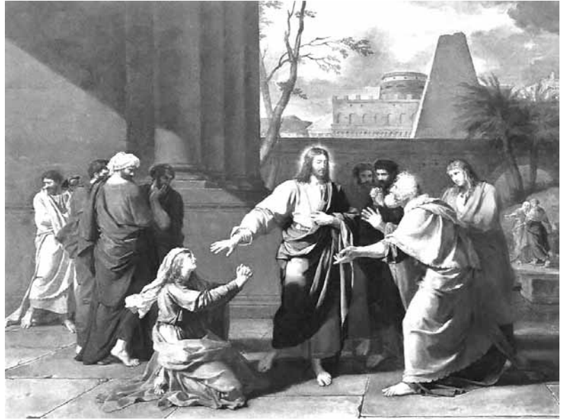
François-Hubert Drouais: A kánaánita asszony

helyem, ahol találkozhatom Istennel és az Ő gyermekeivel. Szétszakitottságunk, politikai és társadalmi hovatartozásunk, mindenféle különbözőségünk dacára van egy központi lelki helyünk, amely mindenki előtt nyitott. Itt vár-