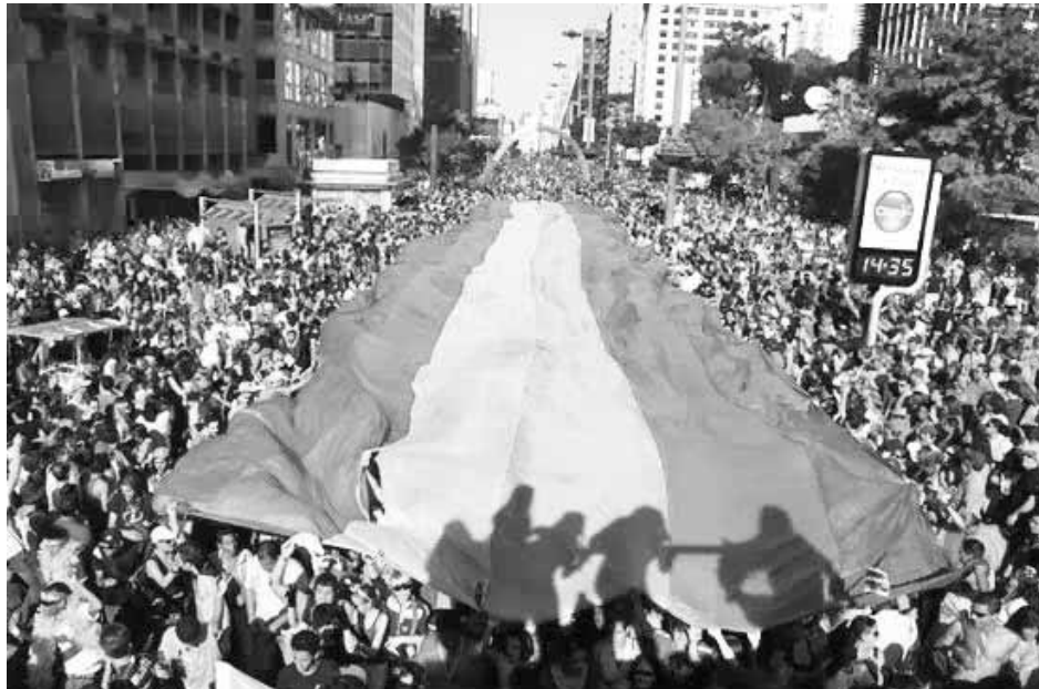
Szivárványszínű zászlóval ezek vonulnak fel jogokat követelve az LMBT számára

Ami mégis heves ellenreakciókat válthatott ki, az némely kategória tisztázatlansága (pl. „gyűlöletbeszéd”), valamint az intézményesülési folyamatokra (házasság, család) bejelentett igény, noha ez csak ajánlás formájában fogalmazódott meg. „Felkéri a tagállamokat, hogy fontolják meg, hogyan tudnák a családjogi törvényeiket a mai változó családi mintákhoz és formákhoz igazítani, és belefoglalni azt a lehetőséget, hogy egy gyermeknek kettőnél több szülője (vagy törvényes gyámja) legyen, mivel ez megnyitná a lehetőséget a szivárvány