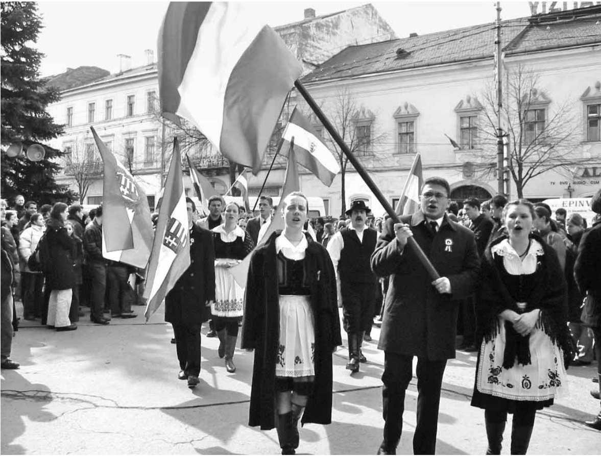
Kolozsvári fiatalok felvonulása március 15-én a város főterén (archív felvétel).

Az 1848-as szabadságharcra lapunk Móra Ferenc A furulya című novellájával emlékeznek, amely a 4. oldalon olvasható.