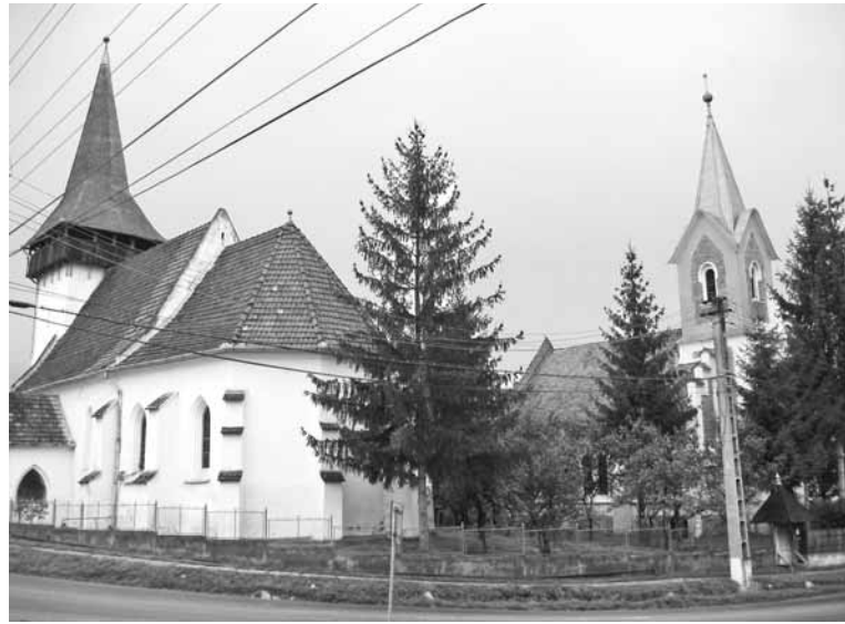
A két magyar templom testvériségben áll egymás mellett

Száz év múlva ez a „nemes versengés” él tovább a két templom és a két gyülekezet éle-tében. A múlt század ki-lencvenes éveiben közös nőszövetségi alkalma-kon gyakran találkoztak, volt közös színjátzó csoportjuk és közös bib-liaórákon imádkoztak együtt. Ahogy ott áll-tam, az ádámosi két ma-