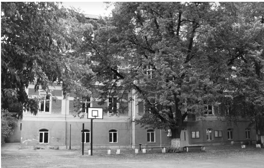
A volt Faipari Líceum épülete.

A fáktól eltakart négyszintes ingatlan a kolozsvári magyar szaktanulmányok központja lehetne.