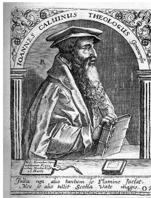
Korabeli grafika a reformátorról