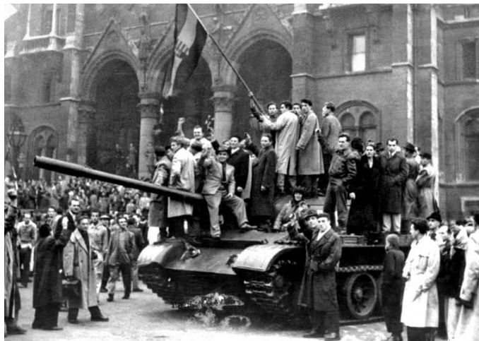
Az 56-os forradalom máig érzetzi hatását

– Mert én hiszek az eszmében, ami jó. A leghaladóbb ma az egész világon. És ti ezt akartátok bemocskolni. Nem sikerült nektek.