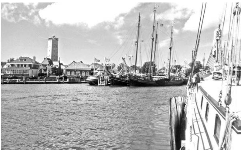
Kikötő Terschellingben: a kis holland sziget csodákat rejtget magában