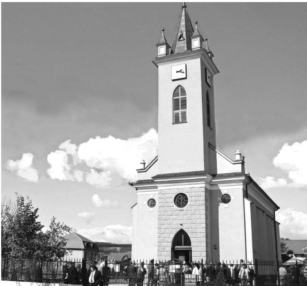
Életképes a szamosfalvi gyülekezet: a százéves templomát is felújította