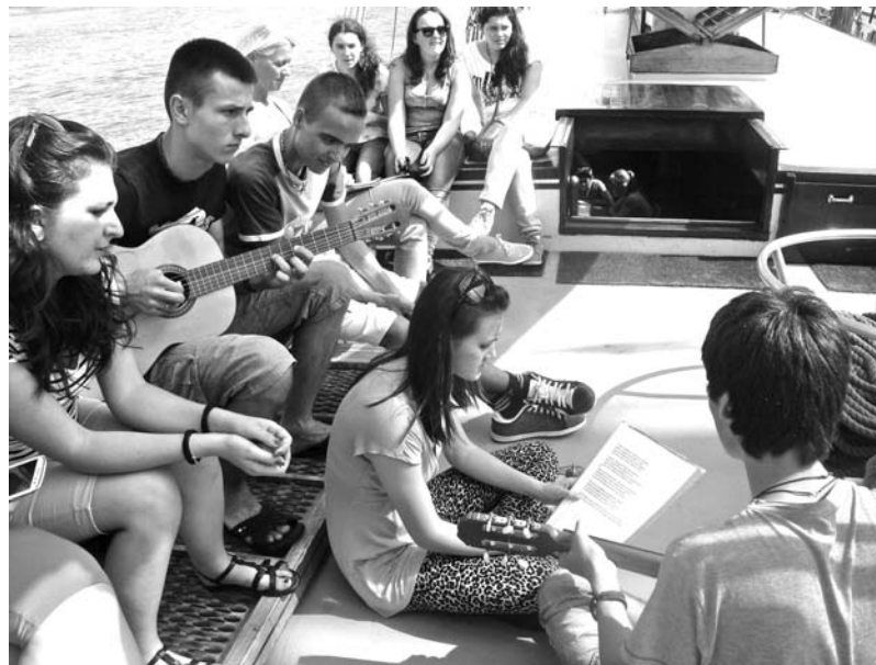
Szélcsendben előkerülnek a gitárok, Istendicsőítő ének hangzik fel

Harmadik nap. Szinte pillanatok alatt érkezünk meg az IJssel-tó és a Watt-tenger közötti gáthoz. Míg arra várunk, hogy átjussunk a zsilipeken és 28 méter magas árbocaink miatt felvonják előttünk a billenős hidat, ismét van időnk elgondolkozni a sajátos holland életfelfogáson. Ebben a kis országban évszázadok óta folyt a küzdelem a tengerrel, hogy minél több szárazföldet hódítsanak el tőle. Így merült fel a gondolat, hogy gáttal zárják el a Watt-tengert az akkor még Zuidersee-nek nevezett beltengertől, mert így a tóvá változó tengerből könnyebb lesz majd kiszakítani szárazfölddarabokat. Az 1920-ban elkezdett gátépítést 1932-re fejezték be. Ma autószertráda vezet át rajta. Az út felénél a titáni munkára emlékmű emlékeztet. Felirata: Egy élő nép a jövőjének épít. Éles ellentétben áll ez a felfogás a mai kelet-európai szemlélettel,