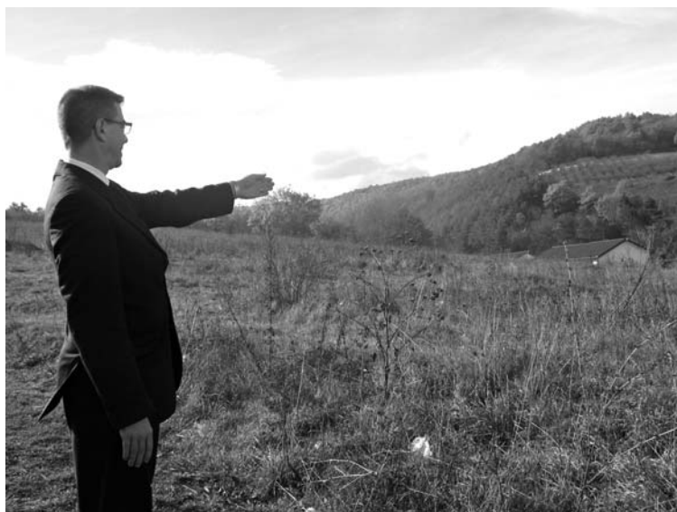
Agoston Attila: ide épül majd a szászfenesiek temploma