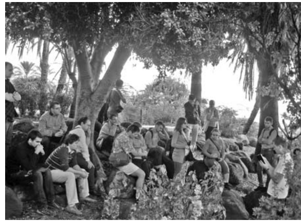
A Boldogmondások hegyén