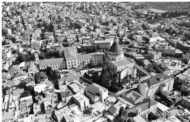
Panoramikus látkép a mai Názáretre

A lelkipásztoroknak sok felejthetetlen szolgálata van. De amikor otthon, a saját falujukban,