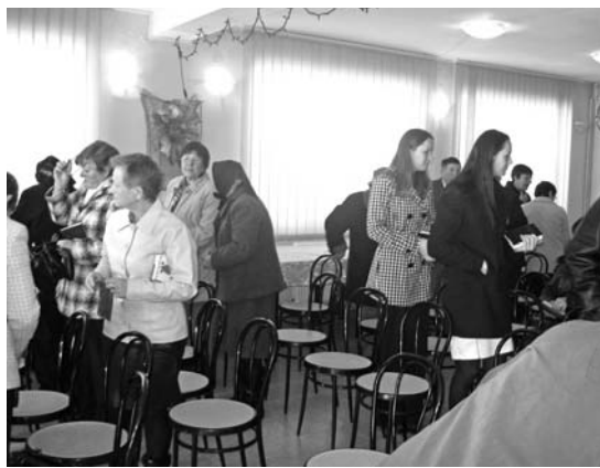
Az ideiglenes istentiszteleti helyen, az ebédlőben

– Nekem is voltak kellemes meglepetéseim: kimagasló perselypénzek. Egyik presbiterünk javaslata alapján vasárnap templomépítési perselyt is elhelyeztünk. Ez pedig nem osztotta meg a begyűlt összeget (ahogy gondolná az ember), hanem megsokszorozta. Innen is érezhető, hogy a hívek támogatják az építkezést. Bizakodóak vagyunk, egymást is bátorítjuk és hisszük, hogy Isten segítségével és alázatos, kitarító munkával szép jövő vár a szászfenesi gyülekezetre.