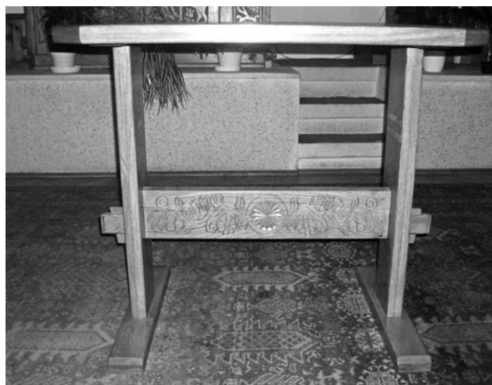
A két asztallábat összekötő faelem közepén rozettát találunk kétfelé nyúló indás díszítéssel. Rózsa, tulipánok, levelek mellett szőlőszemek láthatók: „Ez az Úr asztala, az úrvacsora helye.”

A mai templom azóta is magyaros, népi jellegéről híres. A szószerék és papi szerék az 1992-ben épült templomba került, amelyet Kali Ellák építész tervezett. A templom ki-