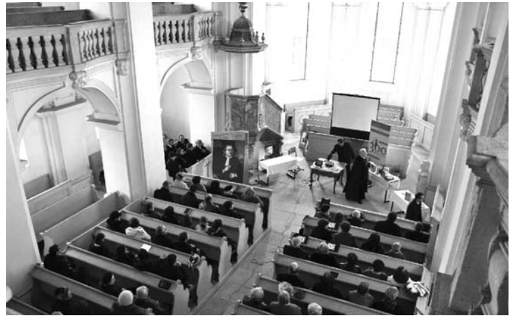
Sokan látogattak el a barokk templomban tartott ünnepségre

Bod Péter, az író és tudós, 1712-ben született Felsőcernátonban, de 1749-től haláláig a magyarigeni lelkipásztori tisztséget töltötte be, amelyet később püspökhelyettesi méltóság is