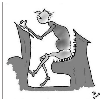
Tükön (Adorjáni László karikatúrái)