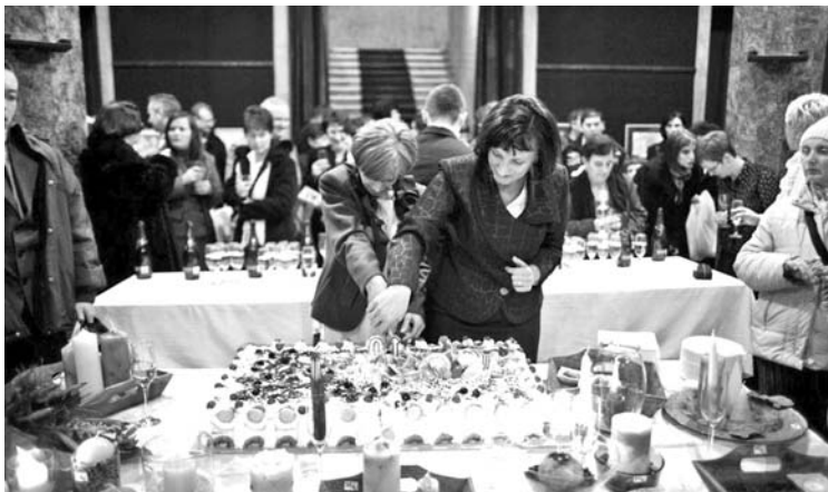
A szülinapi torta sem hiányzott az ünnepségről

Első nap intézménylátogatással kezdtünk, hogy az Alapítvány programjainak, intézményeinek színterét mindenki megismerje. A körút során a résztvevők meglátogatták a Rotary Házban működő gyermekprogramot, majd az otthoni gondozószolgálat és a családsegítő koordinációs irodáját a Gyár utcai épületünkben. Itt a látogatók kiállítást tekinthettek meg: az idősök otthonát megidéző tárgyakkal, az önkéntes programjainkban használt eszközök kiállításával és fényképekkel, leírásokkal szemléltettük, hogy milyen környezetben folyik az otthoni betegápolás, idősmegsegítés különböző szolgálatainkon keresztül. Ez után az udvarban lévő munkaműhelyeket látogatták meg a vendégek: a textilválogatót és az asztalosműhelyt. Innen a három kisbusz az Írisz Házba és az Írisz Boltba szállította tovább a vendégeket, ahol a fiatal szellemi vagy testi fogyatékkal élők nappali foglalkoztatása és munkája zajlik. Az utolsó állomás a nemrég felavatott sepsiköröspataki Írisz tábor volt, ahol családok, fogyatékkal élő fiatalok jöhetnek kikapcsolódásra, képzésre, nyaralásra.