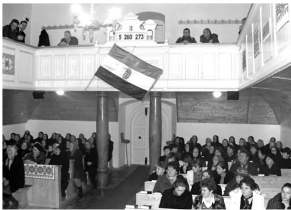
Megemlékezés: Magyarón az idősekre is gondot viselnek