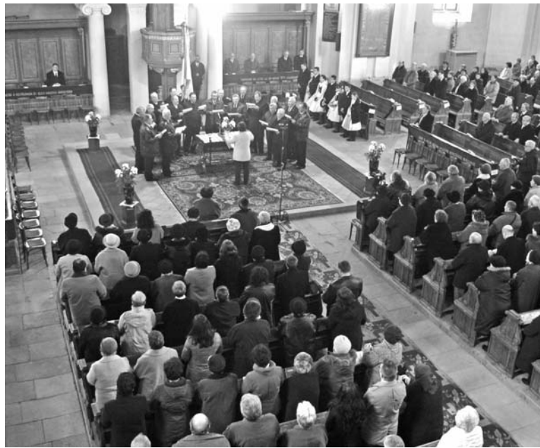
Az ünnepségen a Bethlen Gábor Földész Dalkör is fellépett