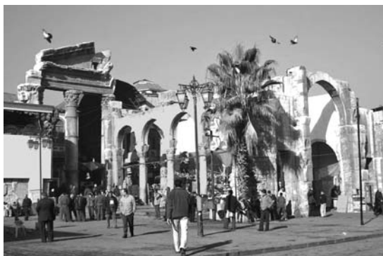
Régi templommaradványok a mai Damaszkuszban

Damaszkusz nevével a Bibliában mindjárt az elején találkozunk. Lót olyan háborúba keveredik bele, ahol nem lehet pontosan tudni ki ki ellen harcol, és ennek áldozata lesz.