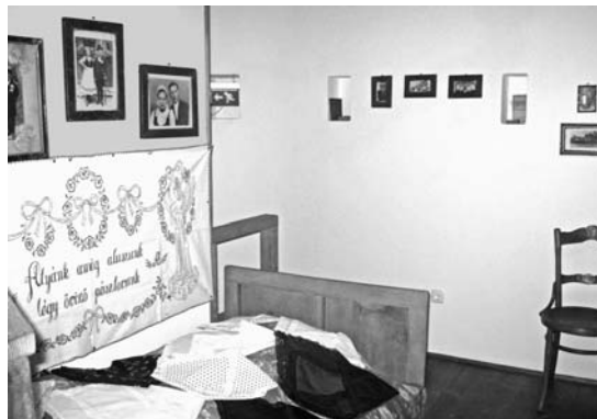
Hóstáti szoba korabeli fényképekkel