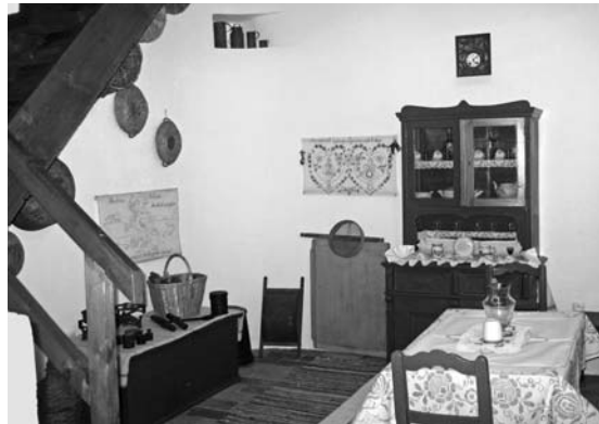
Konyha és berendezése hóstáti módra

eleji kisnemesi, polgári viselethez, annak emlékét őrzi szinte napjainkig. 30–40 évvel ezelőtt a kolozsvári piac sajátos színfoltját jelentették a gyönyörű, tiszta viseletbe öltözött asszonyok, ruhájuk cégtábla nélkül is jelezte az áru eredetét és garantálta annak minőségét.