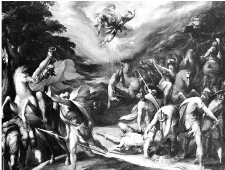
Hans Speckaert: Pál megtérése

A damaszkuszi úton egy ember megy a maga útján, építi karrierjét, és úgy gondolja, mindez Isten akaratával is egyezik. Egyszer csak hirtelen mennyei világosság által földre tiportatik, és át kell gondolnia egész addigi életét. Új irányba kell elindulnia. Pál apostol eddig úgy gondolta, az ő küldetése az, hogy üldözze a keresztyéneket, semmisítse meg a Jézusban hí-