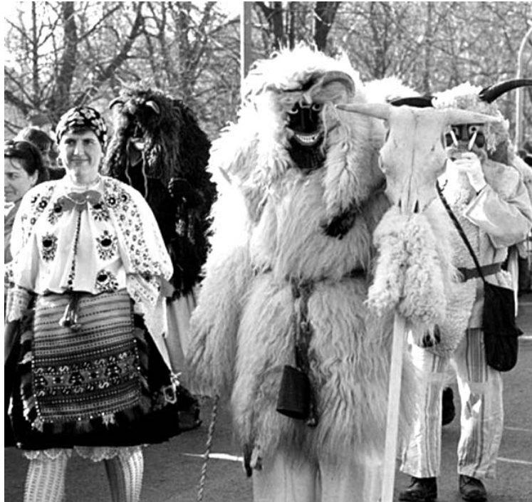
Erdély-szerte egyre nagyobb divatja van a farsangbúcsúztatóknak

A latinul quadragesima elnevezésű negyven böjti nap általános szokás szerint nem a hamvazószerdától húsvétig terjedő összes napot jelentette: kivételt képezett a hat vasárnap, mivel minden vasárnap Krisztus feltámadása