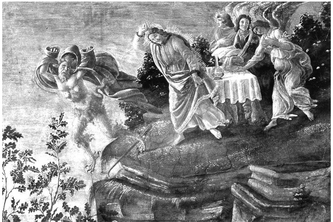
Sandro Botticelli: Krisztus megkísértése

Abba a hibába esünk mi is, mint az egyszerű szerzetes, aki mindenki másnál jobban akart böjtölni, ezért úgy akarta megfékezni a falánkságát, hogy egy kolbászt vett a kezébe, és úgy böjtölt. Az igazi önmegtartóztatás az, ha a vágyunk tárgya jelen van, és mi mégis nem tudunk mondani. Később úgy vélte, még ez sem bizonyítja eléggé, hogy ő milyen ropant nagy akaraterővel rendelkezik, ezért arra gondolt, hogy akkor tudná igazán megtartóz-