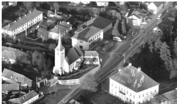
Az erdőszentgyörgyi templom

Mintegy hétszáz erdélyi református templom színes felvétele található a tizenöt füzetben, mindegyik egyházmegye külön-külön. Árpád-kori templomok Dél-Erdélyben, egyháztág nélkül maradt jeltemplomok a Mezőségen, nagyvárosi