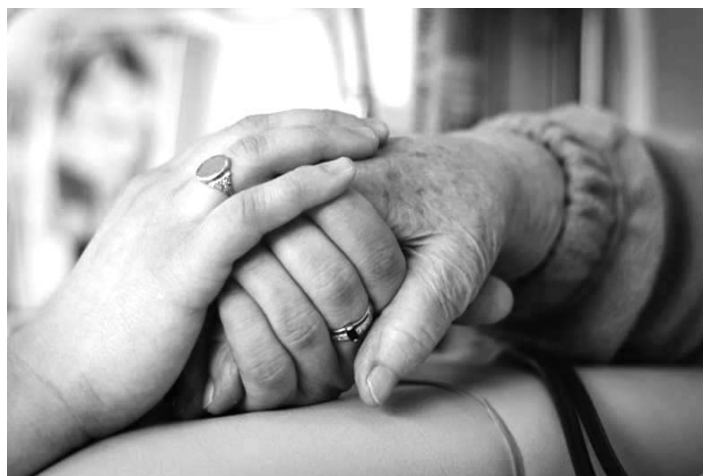
A megértésre, jó szóra és segítő jobbra a kórházban is nagy szükség van

Nagyvárosban született, ott élt néhány évtizeden át. Járt iskolába, volt munkahelye és családja. 1990-ben elveszítette a munkahelyét, aztán a felesége beadta a válókeresetet. Egyetlen leányukat a hajléktalan férfi szülei nevelték. Néhányszor Magyarországra utazott, cse-rekereskedelemmel próbálta eltartani magát. Mindenféle alkoholt fogyasztott, egészségügyi