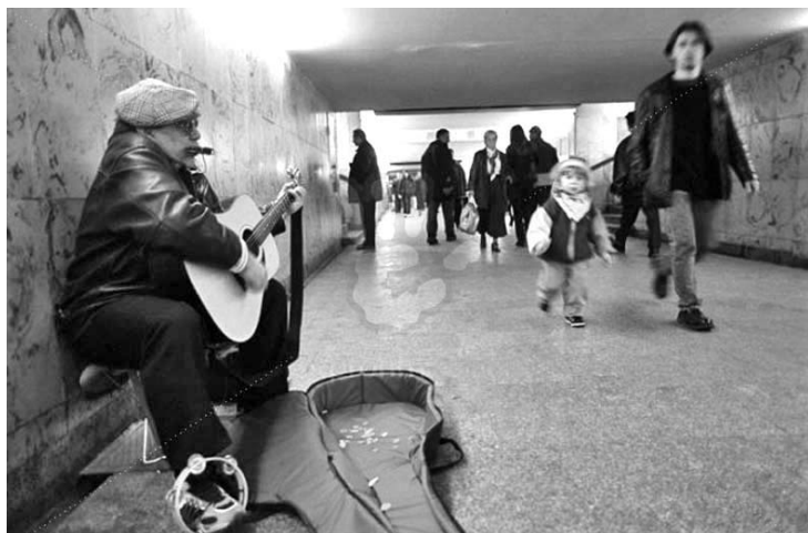
A nagy sietségben szinte soha nem figyelünk a körülöttünk levőkre

„Hideg januári reggel volt amikor egy ember megállt egy Washington DC-i metróállomáson és hegedülni kezdett. Hat Bach-darabot játszott összesen negyvenöt percen keresztül. Ez alatt az idő alatt több mint ezer ember fordult