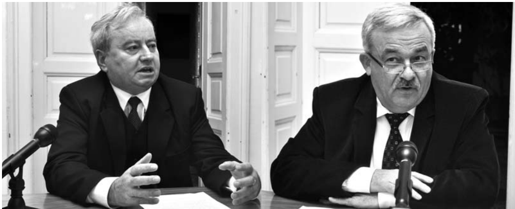
Csúry István és Kató Béla püspökök. Az egyházi vezetők elégedetlenek a restitúciós törvénytervezettel.

Nem kárpótlás történik, hanem kártétel – mondta a sajtótájékoztató keretében Csúry István királyhágómelléki püspök. – Úgy érezzük, hogy a készülő törvény – amelyre a román államot az európai fórumok kötelezték – nem előrelépést, hanem visszalépést jelent.