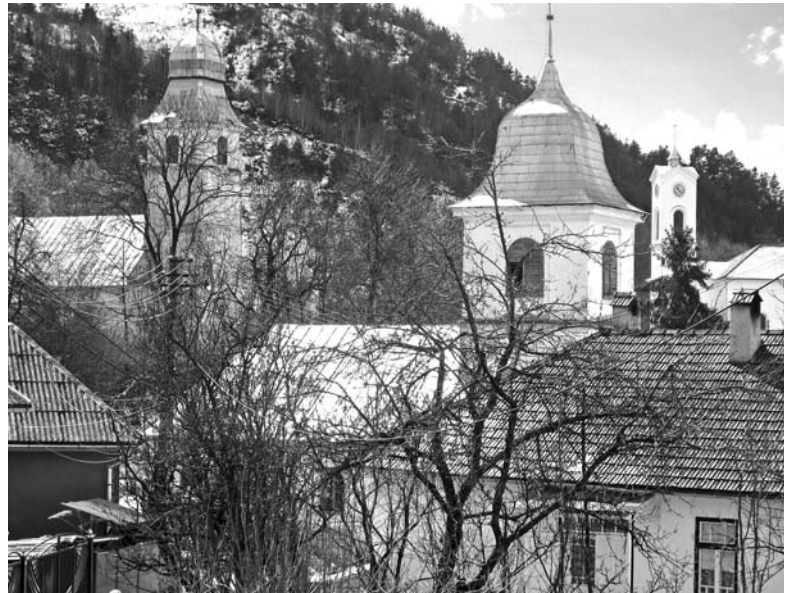
A három magyar templom (református, unitárius, katolikus) Verespatakon