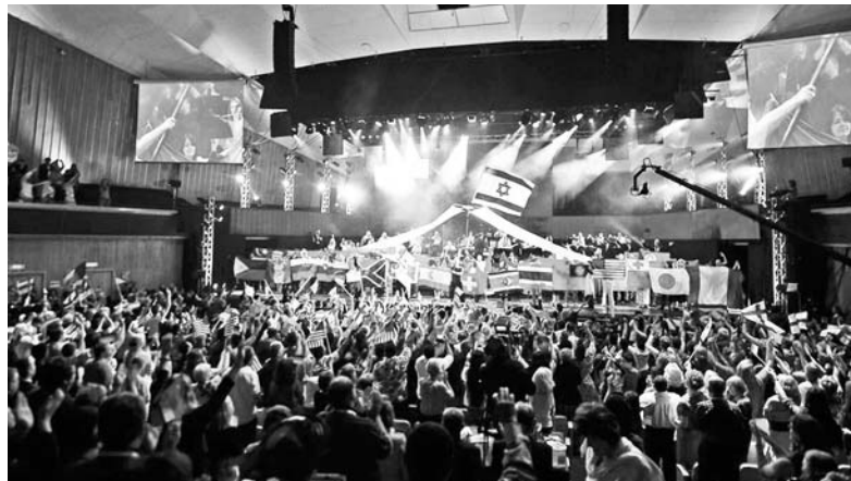
Modern fényeffektusok és zászlóerdő a kibérelt csarnokban: folyik az agymosás

kezetének a tulajdonát képezi. Az is megtörtént, hogy az egyik gyülekezet pásztorja azt mondta nekünk nagy lelkesedéssel: „Tudjátok mit, dobjunk össze a Németh Sándornak 150 ezer forintot!” És mi összedobtuk neki a 150 ezer forintot hat istentisztelet alatt. Németh Sándortól néhány nap