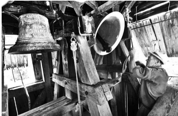
A harangok mindig együtt és egymásért szólnak (Madarasi-Fekete, Maros megye)

Évezredes magyar történelmünk része és velejárója a harang, harangozás. Megpróbált erdélyi életünk jajkiáltásaként jelennek meg metaforás könyvcímeink: „Riadóra szól a harang”. Szűkebb pátriánk különleges ajándéka, hogy itt a harangok mindig együtt és egymásért szóltak, így lehetett